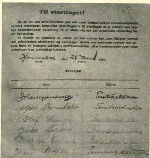
En av de mange protestlister — som samlet over 60 000 underskrifter — mot forslaget om voldgiftslov i 1913.