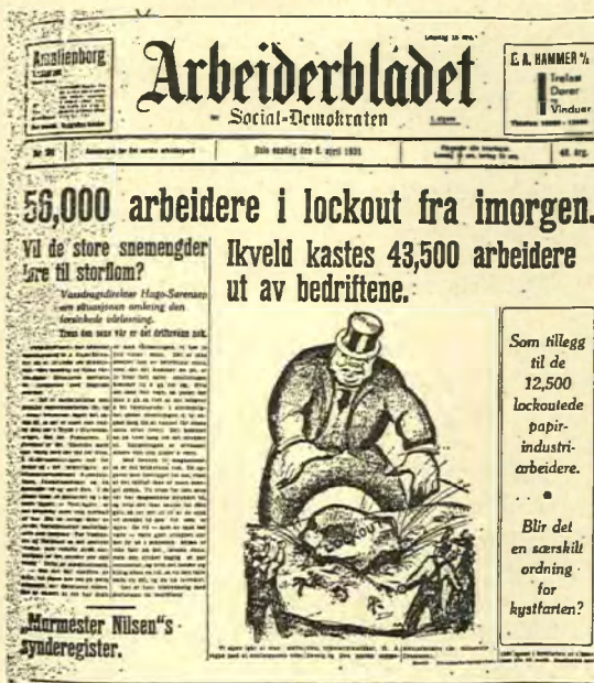
Arbeiderbladets førsteside 8/4-1931.

I mai kom det istand ny mekling. Også under denne meklingsrunden ser det ut til at den faglige ledelse gikk inn for avtaler etter den såkalte danske linje. 38 Det betydde at fagorganisasjonen i prinsippet godtok reduksjoner av lønningene, men gjorde det til et forhandlings spørsmål hvor stor reduksjonsprosenten skulle være. Sannsynligvis satset ledelsen på at den i alle fall ikke skulle bety en senkning av real-