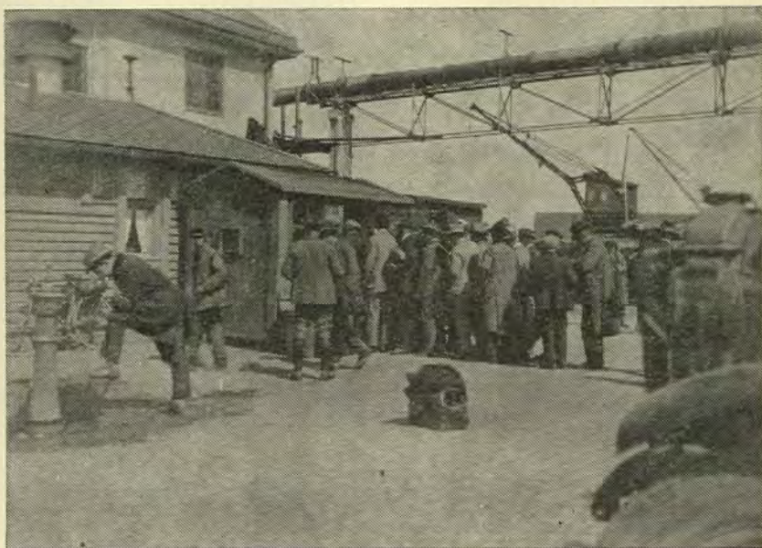
Streikebrytere «hever sine judaspenger» på Oslo havn, 14/6-1924.

En annen gruppe konflikter hvor det er usikkert om Byrådet har fulgt de samme prinsipper gjennom hele tidsrommet, er de hvor arbeidsstansen ikke ble effektiv fordi det lyktes å skaffe streikebrytere. Vi kan konstatere at Syd-Varanger-konflikten 1928—29 er holdt utenfor, og at det samme gjelder Foldalkonflikten 1929—31. Byrådet begrundet det slik i 1930: