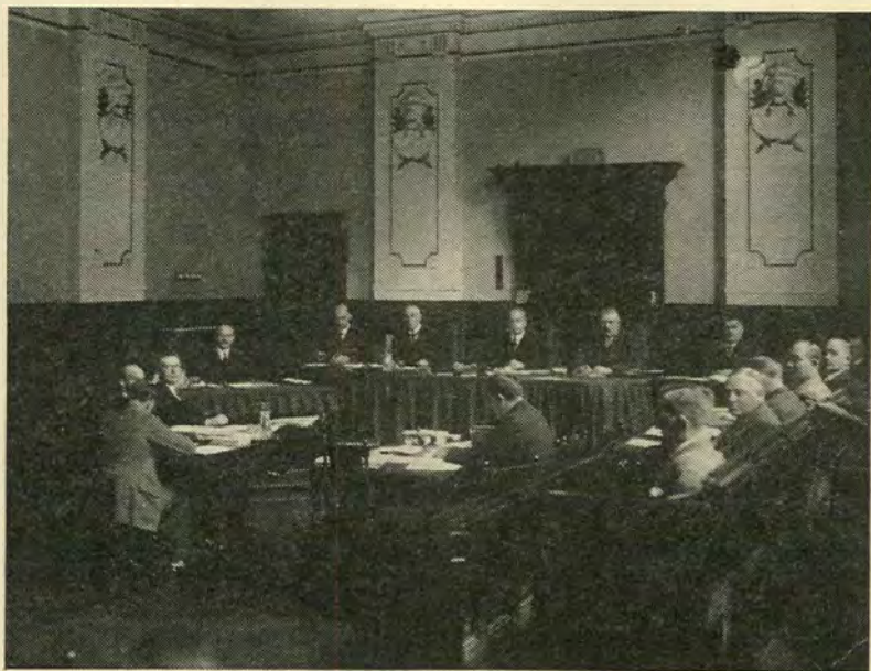
Fra sakene i Arbeidsretten som fulgte etter Follaldskonflikten. Rettens formann: Paal Berg.

Konflikt var blitt en kamp for organisasjonsretten. Det sentrale spørsmålet var blitt å få verket til å gå med på opprettelse av tariffavtale. Med anmodningen om forhandlinger var dette i realiteten oppnådd. Vi skal derfor bare ta opp to