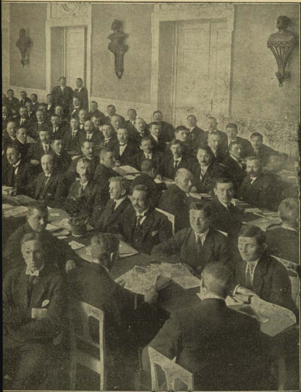
as kongres 1923.