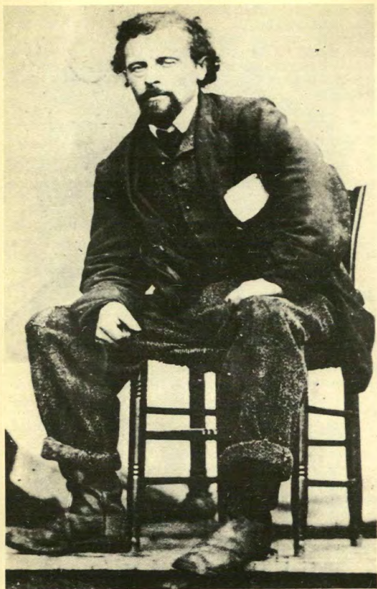
Markus Thrane i fengsel.