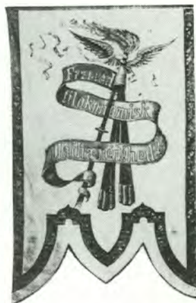
Baksiden av Jern og Metalls første fane fra stiftelsesåret 1891 bærer mottoet: «Fremad til økonomisk Uafhængighed!».

I de lange fredsperiodene skulle forbundet konsentrere seg om å påvirke arbeidsmarkedet. Et middel til dette var en sentral reise- og arbeidsledighetskasse, som ble opprettet i 1900. Ledighets- og reisebidrag skulle gjøre arbeidskraften mobil, og