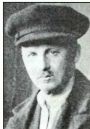
Nikolaj Bukharin slik han så ut under sitt første Norgesopphold. Bildet er tatt enten i 1916 eller 1917.

"...Jeg hadde da rik anledning til at lære hans enestaaende charmerende væsen at kjende. Naturligvis kunde han heller ikke her holde sig passiv. ...Han gik paa møter for at orientere sig i den norske bevægelse, han drev underhaandsagitasjon for de bolchevikiske synsmaater og medarbeidet flitigt i " Klassekampen ". Hans internationale kroniker og hans glimrende artikler under merket "Nota Bene" vakte berettiget opsigt blandt partifæller." 7