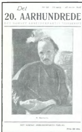
Bukharins portrett pryder forsiden til Arbeiderpartiets tidsskrift, Det 20. Aarhundrede , nr. 2, 1922.

Kongressen styrket Bukharins prestisje hos hans menings-