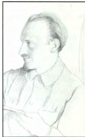
Bukharin tegnet av I. Brodski under Kominterns 2. kongress i 1920.

I litteraturen om Bukharin finnes det to tolkninger av hans posisjon i Komintern i denne perioden. Sovjetiske forfattere