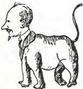
Bukharin. (Tegnet av ham selv.)