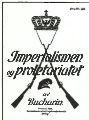
Bukharin-utgivelse på Socialdemokratisk ungdomsforbunds forlag i 1918.