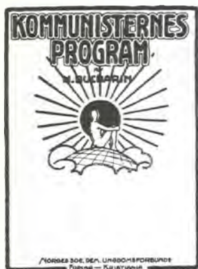
Bukharin-utgivelse på Socialdemokratisk ungdomsforbunds forlag i 1920.

munistiske biograf Haakon Lie, “alltid hadde mye godt å si om ham”. 8 I Peder Furubotns øyne var Bukharin en “veldig kjekk kar” og en jevnbyrdig kamerat. 9