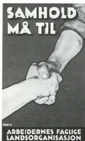
Plakat utgitt til LOs store agitasjonskampanje i 1935.