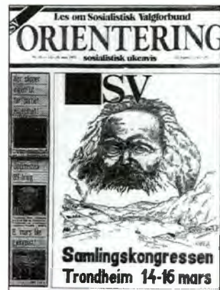
Samlingskongressens plakat prydet forsiden av Orientering 13. mars 1975.