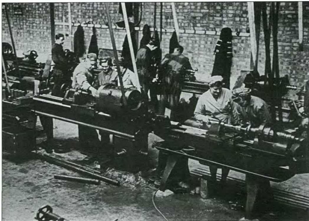
Kvinnelige arbeidere ved dreiebenken, England 1941.

Kontakten med britisk arbeiderbevegelse har blitt tillagt stor betydning for planarbeidet. De ansatte ved LOs London-sekretariat var til stede ved flere av Labours og TUCs kongresser og fulgte nøye med på den britiske arbeiderbevegelsens utforming av et program for etterkrigstiden. Det britiske programarbeidet startet i 1941 og programmet ble lagt fram på det britiske arbeiderpartiets kongress i 1943. Ifølge historikeren Øyvind Stenersen er det påtagelige likheter mellom dette programmet og de planene eksil-LO utarbeidet. 14 Organiseringen av britisk arbeidsliv og