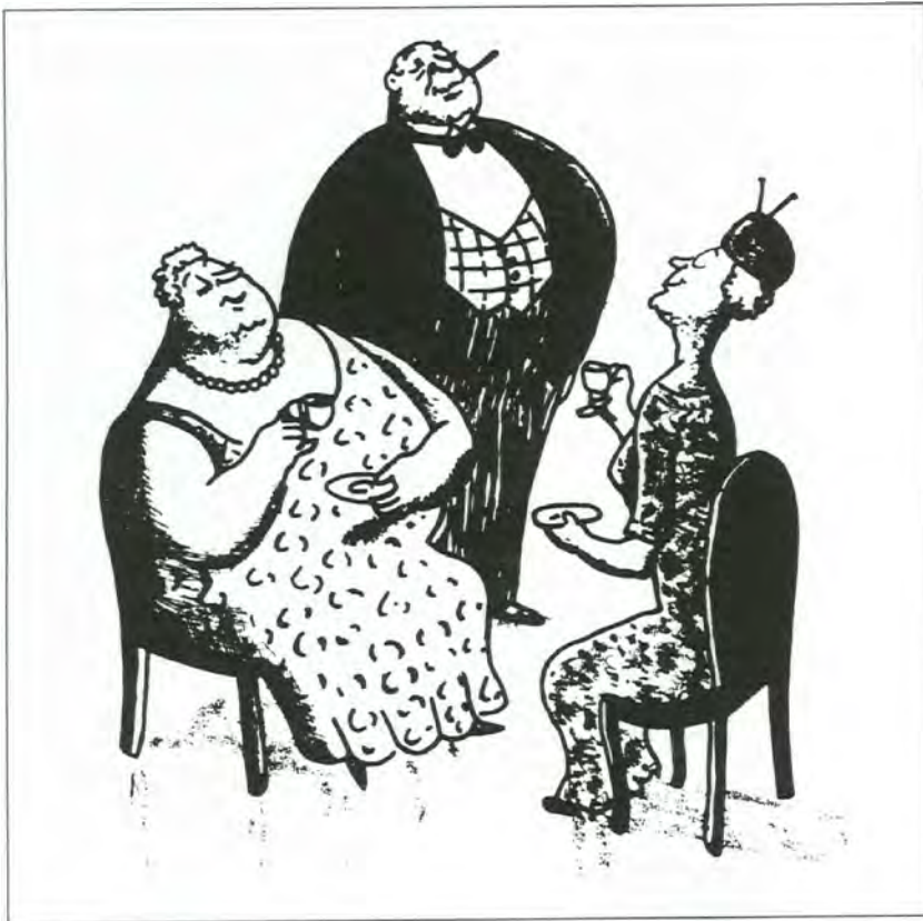
"No! George refuses to have a Production Committee and sit together with ignorant people!" New Propellor, juni 1942

De amerikanske utvalgene fungerte ikke like godt overalt. Det har blant annet vært lagt vekt på at ledelses- og samarbeidsformer i den enkelte bedrift forut for nedsettelsen av produksjonsutvalgene var avgjørende for hvor godt samarbeidet kunne bli under krigen. Generelt