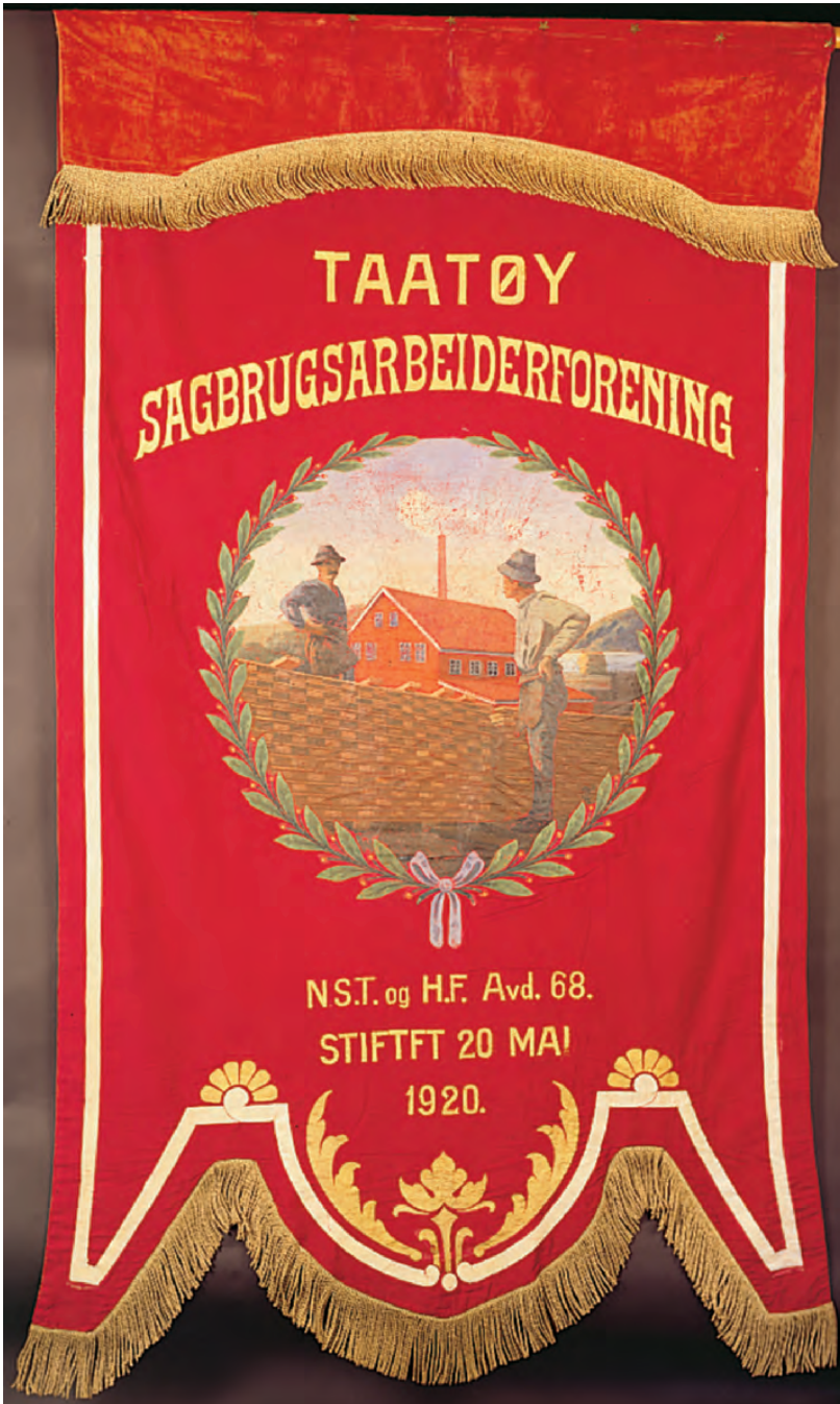
Rundt omkring i landet fantes mange dyktige fanekunstnere. Fanen til Taatøy sagbrugsarbeiderforening er laget av Christian Rasmussen i Kragerø i 1921.