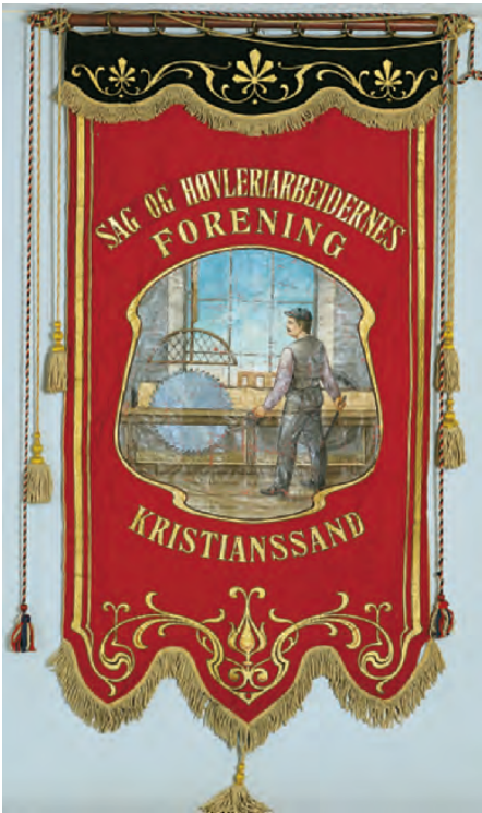
Den vakre fanen til Sag og Høvleriarbeidernes forening i Kristiansand ble laget av byens dyktige dekorasjonsmaler Thorkild Gill i 1909.

skapes av en kunstnerisk avantgarde, men at en uttrykte seg innenfor et bildespråk som samtida forstod. 10 Til dette bildespråket hørte en rekke standard-symboler som var godt kjent i samtida. På arbeiderbevegelsens faner finner vi også en rekke av disse allmenne symbolene, først og fremst som deler av den ornamentale utsmykningen eller som bimotiv på fanene.