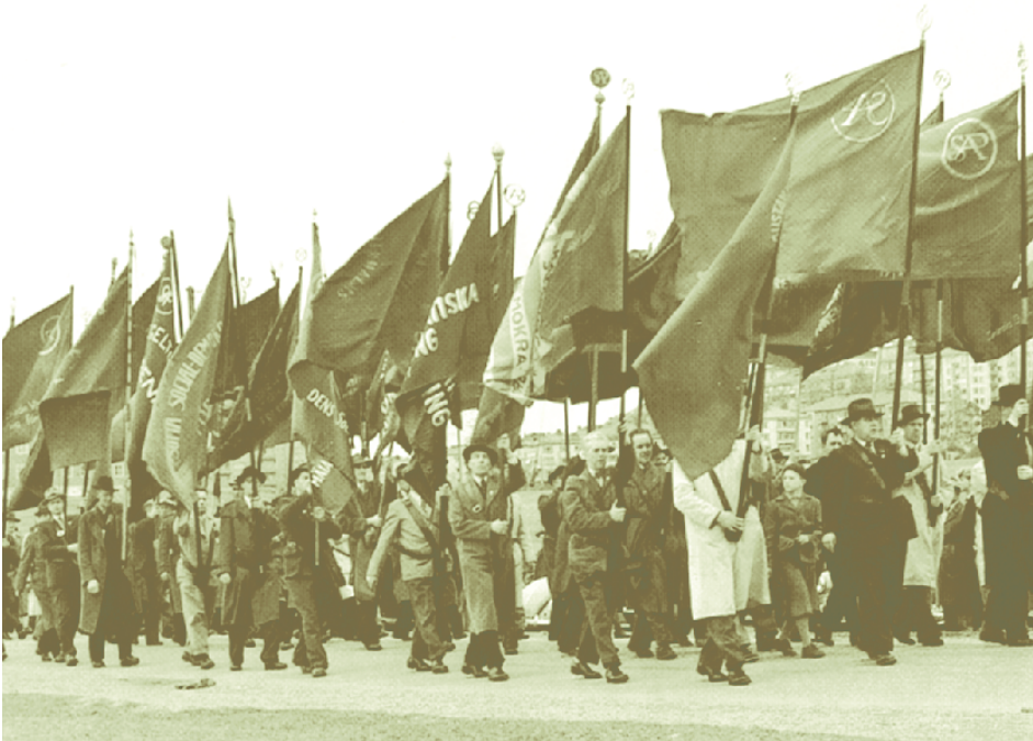
Svensk 1. mai-tog med røde faner i teten. (Omslagsbilde til Och skulle jag svika min fana röd , Sthlm. 1992.)

Hva kunne være årsaken til at fagbevegelsens fanetradisjon fikk en helt annen utvikling her i Norge enn i de fleste andre land? Det kommer neppe av at norsk fagbevegelse har vært noe mindre radikal enn fagbevegelsen i våre naboland, det motsatte har heller vært tilfelle, iallefall i enkelte tidsperioder.