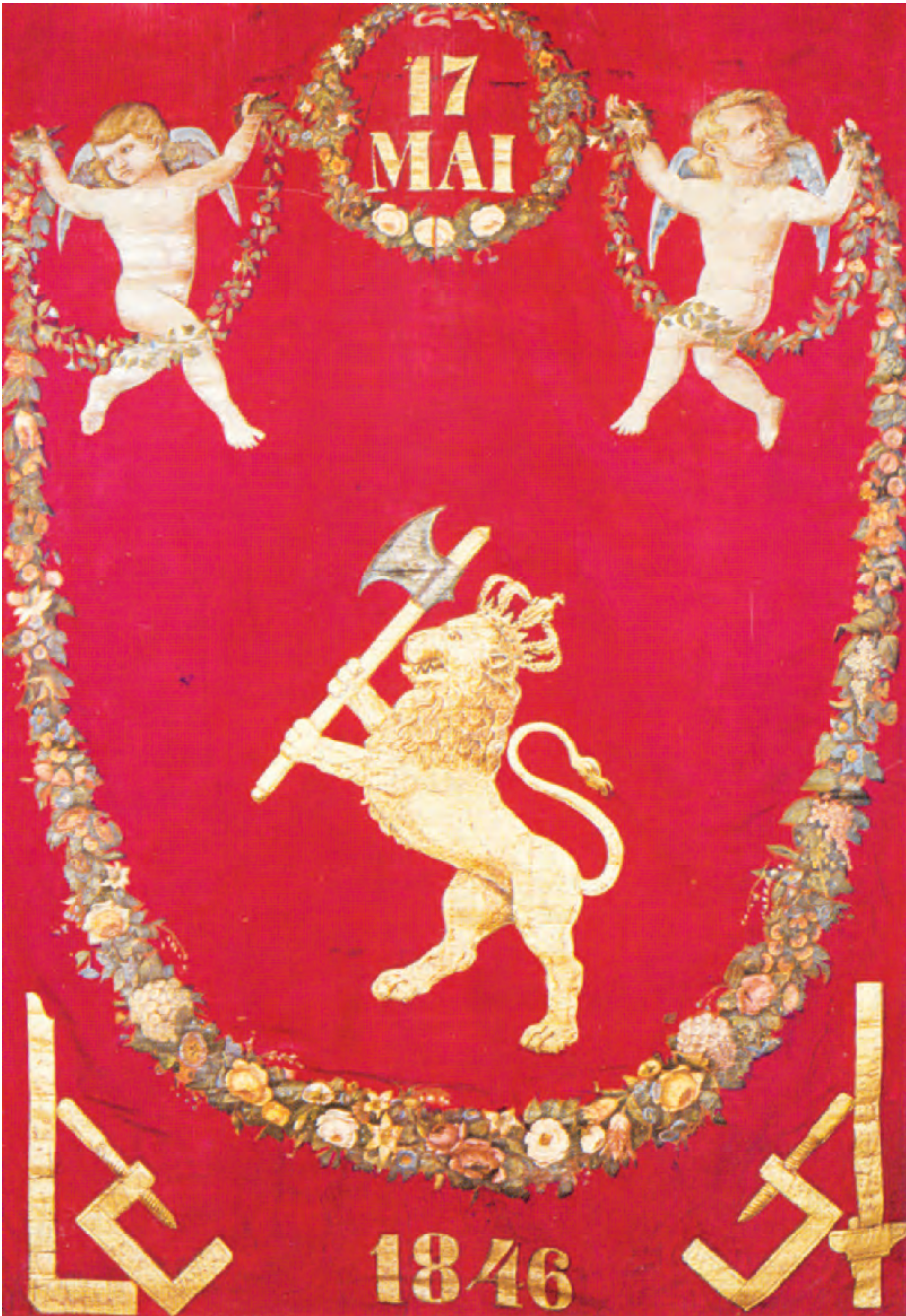
Baksiden av den gamle håndverksfanen til skreddersvennene i Kristiania er dekorert med den norske løve, arbeidsredskaper, blomsterlenker og amoriner. Vi ser at fanen ble innviet 17. mai 1846.