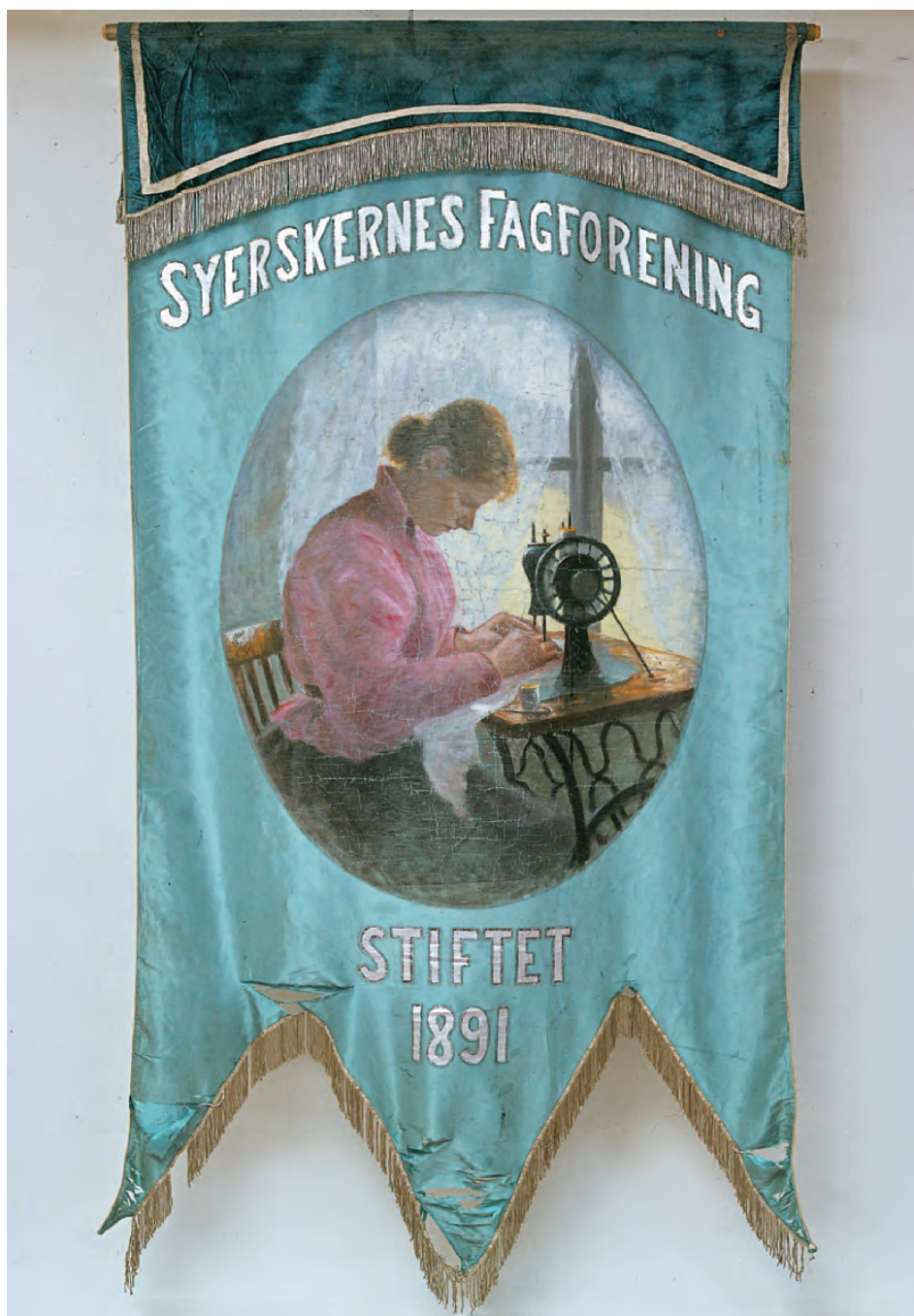
Fanen til Syerskenes Fagforening i Kristiania er en av de vakreste fagforeningsfanene vi har. Den ble laget i 1894, tre år etter at foreningen ble stiftet.