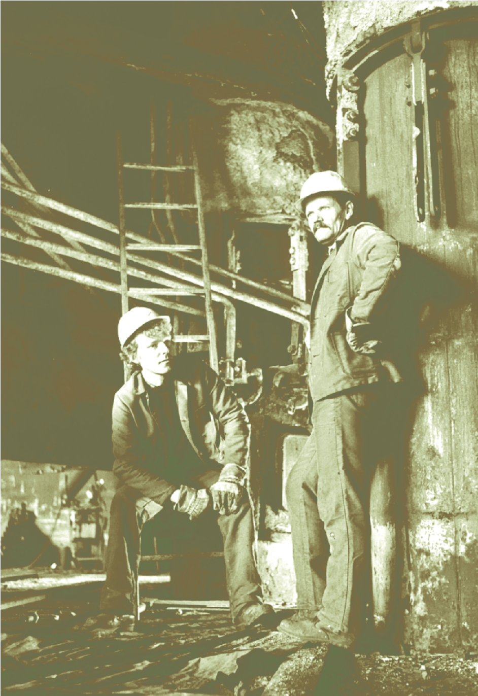
Dystre utsikter for gutta på gølv.