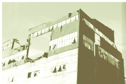
Tinfos Jernverk på Notodden var blant de smelteverkene som ikke overlevde 1980-tallet. Bedriften ble nedlagt i 1987 og revet i 1993.

Vi ser altså at forbundet hadde kontakt med en lang rekke personer og organisasjoner både på arbeidsgiver- og arbeidstakersiden, i regjeringen og på Stortinget. Mye av arbeidet gikk ut på å skape enighet og framstå med størst mulig grad av felles oppfatninger overfor den stortingskomiteen som skulle behandle saken. Brevet til foreningene