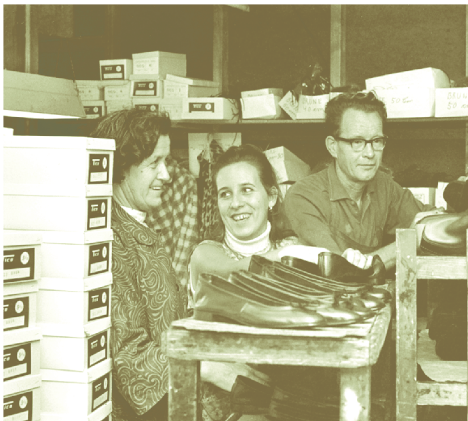
Etableringen av frihandelssamarbeidet EFTA medførte sterk konkurranse for skoindustrien. I løpet av 1960-tallet ble antallet skotøyarbeidere halvert. Bildet viser tre av de ansatte ved Tico, en skobedrift som ble etablert av ti tidligere ansatte da Halden skofabrikk ble lagt ned.

triveksten landet opplevde utover på 1960-tallet. I tillegg til å yte lån, etablerte myndighetene garantiordninger og ga skattelettelser som skulle fremme investeringer i industrien. En viktig begrunnelse for myndighetenes sterke engasjement, og for den brede politiske enigheten om satsingen, var den nye markedssituasjonen norsk industri ble stilt overfor etter etableringen av det europeiske frihandelssamarbeidet EF-