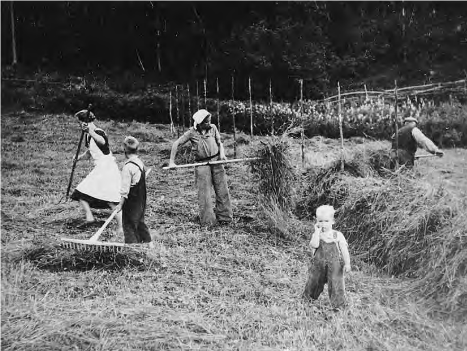
Hele familien i arbeid under høytønnen. Fra et småbruk på Østlandet, siste halvdel av 1930-åra.

1939 foreslo «maktmiddelnemnda» i laget å innføre «streik», å halde tilbake jordbruksvarer frå marknaden, som verkemiddel for å presse gjennom krav overfor styresmaktene. Dette var starten på det som vart «aksjonsrørsla» etter krigen, og som også så vidt kom til syne alt i 1939. 40 Her kan det trekkjast linjer bakover til åra først på 30- talet, då Bygdefolkets Krisehjelp fekk gjennomslag for ei aksjonslinje hos bøndene. Elles fanst det parallelle utviklingstrekk i Sverige. Men like påfallande var det at Bondelaget no tok opp aksjonsformer som låg nær kampformene i arbeidar-rørsla, bygt på prinsippa om solidaritet og kollektiv handling. Dei gamle «korn-