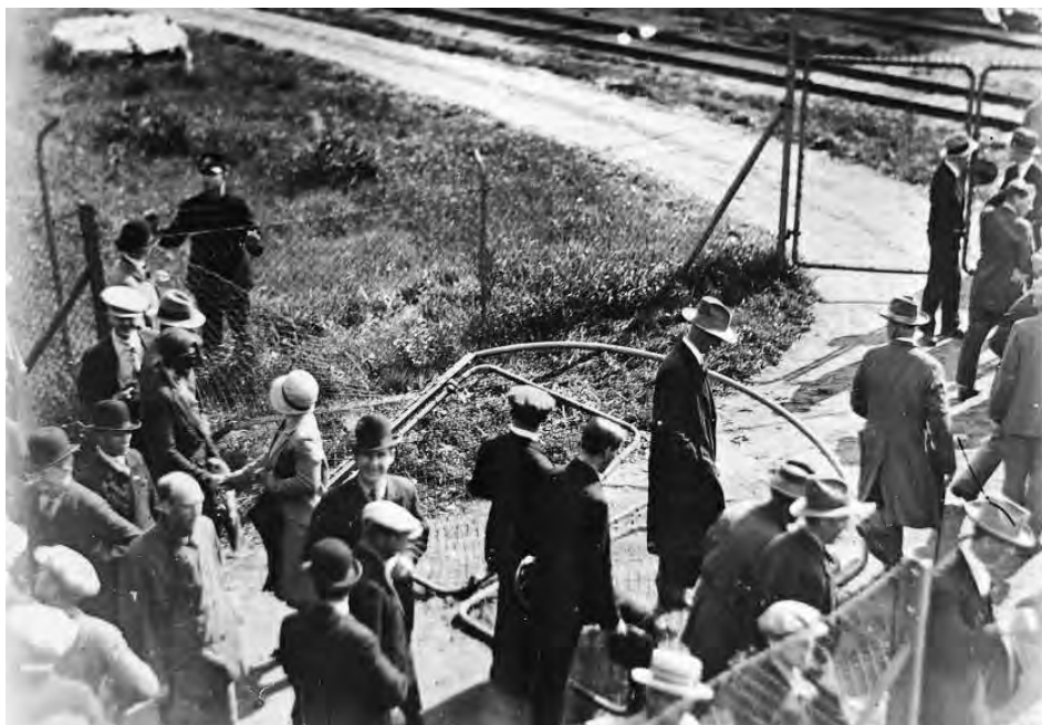
Porten til lasteplassen på Menstad er revet ned, og demonstrantene strømmer inn, 2. juni 1931.

folk stormet så inn på Menstad lager og losseplass. De jaktet på kontraktarbeidere som hadde søkte tilflukt i kontorbygningen. Flere ble funnet og hentet fram «til beskuelse». 14