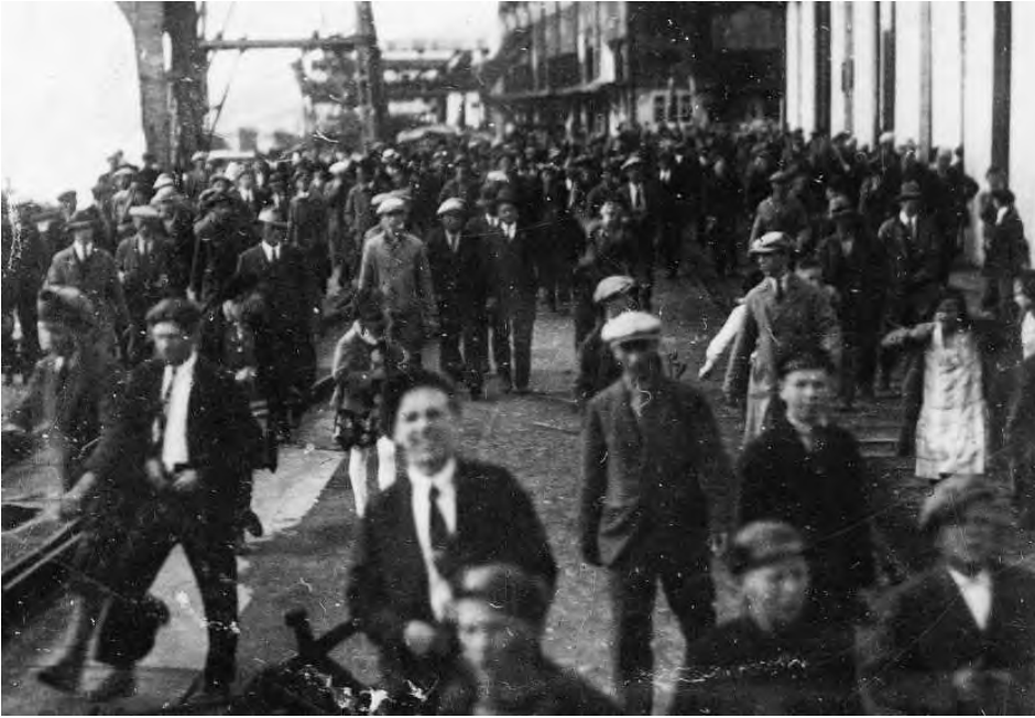
Demonstrantene har kommet seg inn på kaiområdet på Menstad på jakt etter kontraktarbeidere, 2. juni 1931.