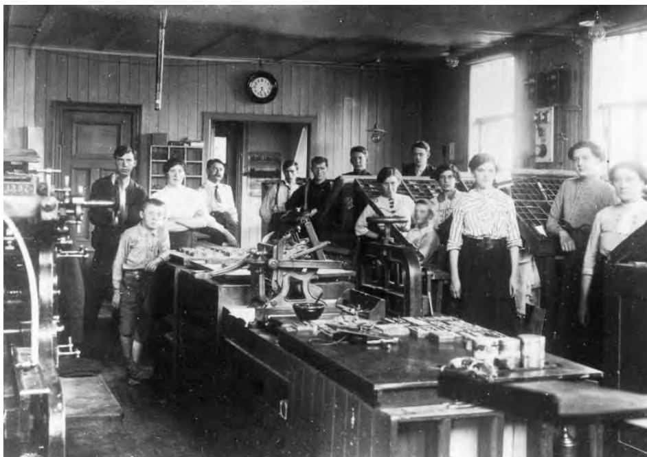
Kjønnskonflikten var særlig tilspisset i typograffaget, der de mannlige typografene i mange å forsøkte å presse sine kvinnelige kollegaer ut av faget. På bildet ser vi L/L Inntrøndelagens trykkeripersonale i 1914.

organisasjonen som menn fordi de utgjorde en minoritet og fordi de likevel snart skulle gifte seg. 4