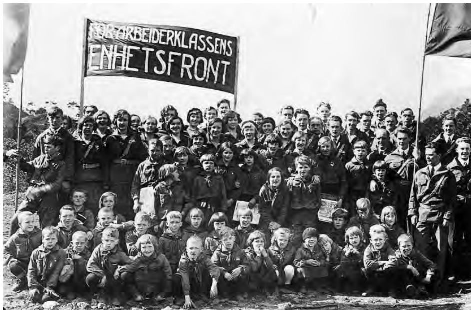
Unge pionerer i Stavanger demonstrerer for «arbeiderklassens enhetsfront» 1. mai 1933.

partiene om å søke direkte forhandlinger med ledelsene for de sosialdemokratiske partiene for å få reist en enhetsfront. Dette var et forvarsel om – noen vil hevde innledningen til – en omvurdering av sosialdemokratiet som lå til grunn for folkefrontpolitikken som ble satt ut i livet året etter og bekreftet av Kominterns 7. kongress i 1935.