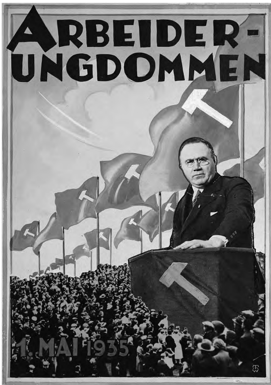
Hammermerket har fått en dominerende plass i Thor Wiborgs fotomontasje på forsiden av Arbeider-Ungdommens 1. mai-nummer 1935.