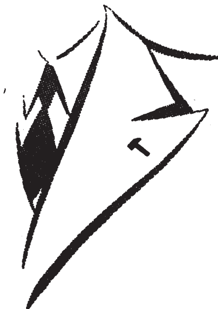
Hammermerket brukt som jakkemerke. Fra brosjyren «Om hammermerket», utgitt av AOF i 1934.

enhetsmerke, ser vi av et brev oversendt Landsorganisasjonen 30. mai 1934. 6 Til brevet er festet et lite hammermerke i stål, og det blir opplyst at et slikt merke kan framstilles for 10 øre, slik at alle arbeidere, også de arbeidsløse, kan ha råd til å kjøpe det. «Et slikt merke vilde i tilfelle være det beste mottrekk mot de emblemer som fascistene søker å innføre i vårt land, nemlig hakekorset og St. Olavsmerket,» understrekes det videre i brevet.