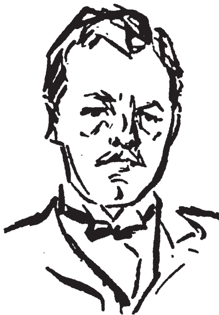
Social-Demokratens tegner Gerda Graff laget dette portrettet av Sigurd Simensen under Jern og Metalls landsmøte 1918.

Selv om Norge ikke var delaktig i krigshandlingene under første verdenskrig ble det vanskelige tider med stor prisstigning og vareknapphet. Ikke minst av denne grunn ble brede grupper av