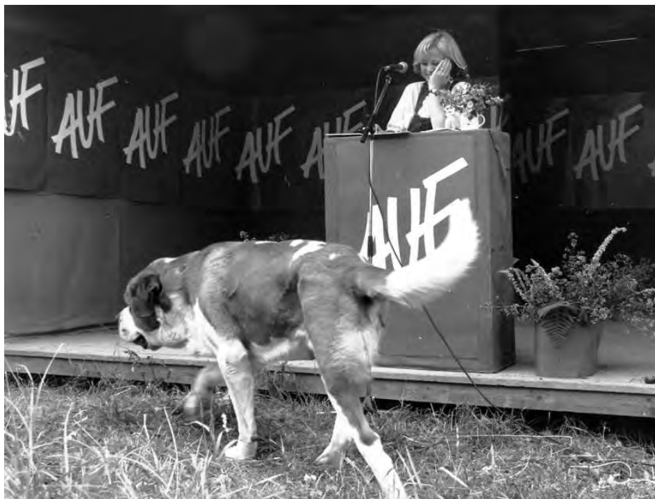
Arbeidernes Ungdomsfylking – vaktbikkje, men ikke løshund.

for sin linje, med det resultat at 90 prosent av medlemmene forsvant!