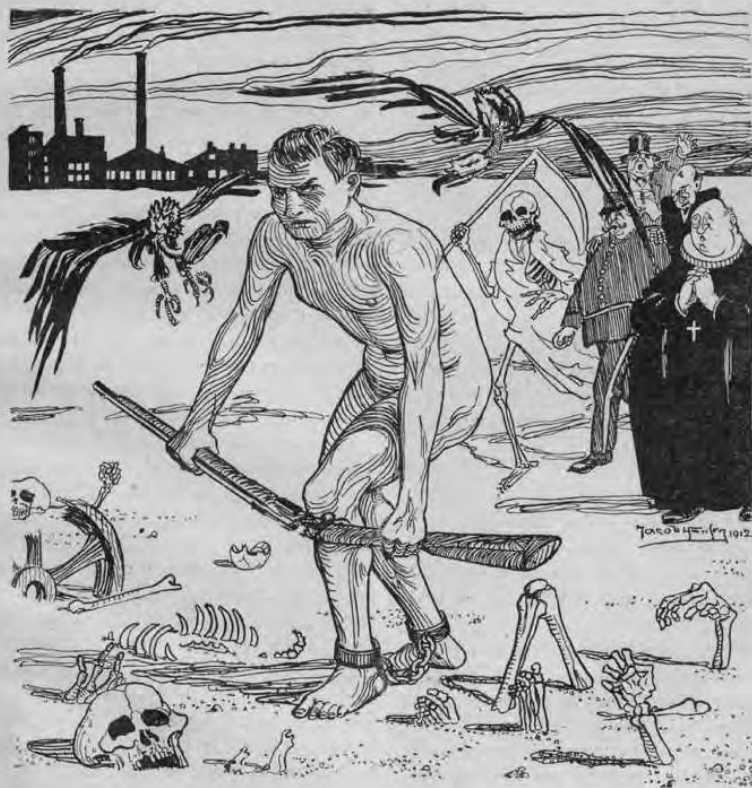
Antimilitaristisk agitasjon i Klassekampen 11. mai 1912.