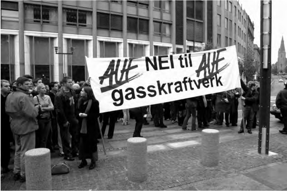
I miljøpolitikken har moderpartiet blitt sterkt kritisert av AUF. Her har en gruppe demonstranter med AUF-lederen Eva Kristin Hansen i spissen tatt oppstilling utenfor regjeringskvartalet i oktober 2001.

på venstresiden og fikk viktige verv der. Det gjaldt i NKP (formenn som Peder Furubotn, Henry W. Kristiansen, Emil Løvlien og Martin G. Knutsen), i SF (som den ledende parlamentariker Finn Gustavsen og hans vararepresentant Torild Skard) og i SV (som partileder Berge Furre og en ledende parlamentariker som Arent M. Henriksen).