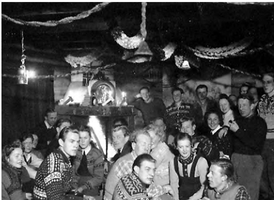
AUF-ungdom gikk aktivt inn i motstandsarbeid under krigen. Bildet er fra en illegal tur på «Tårnhytta» i Bærum i 1941.

Denne overgangen til NKP innebar at det var et politisk mer enhetlig AUF som kom ut av motstandskampen.