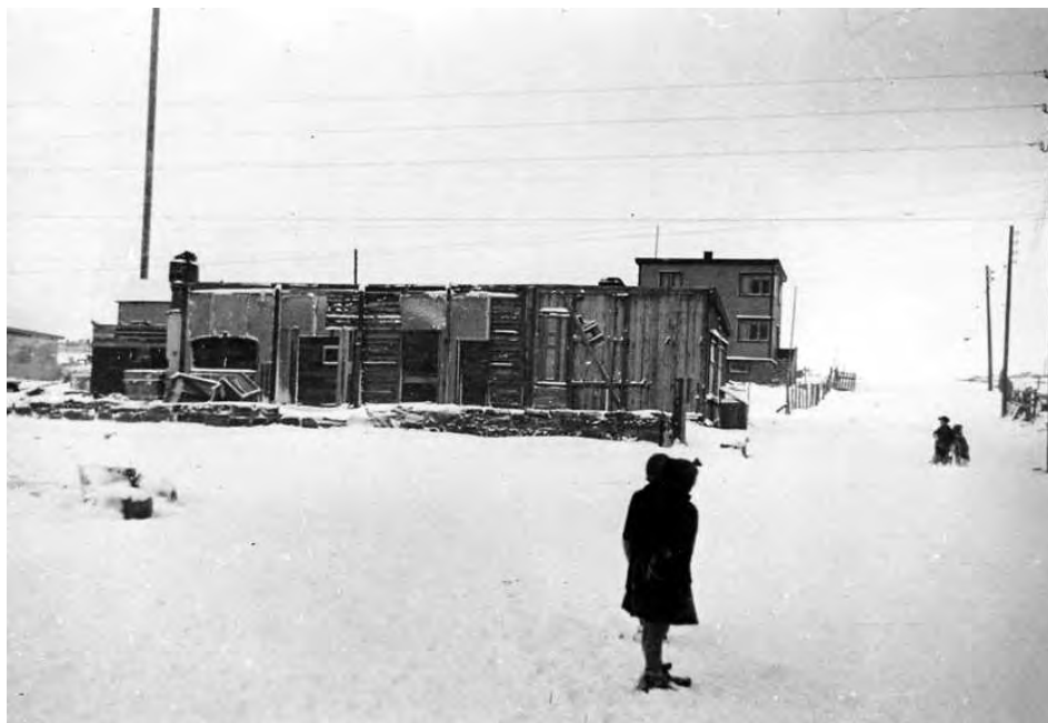
Avisa Finnmarken var den eineste avisa som utkom i Finnmark dei første åra etter krigen. I dette huset i Vadsø blei avisa trykka i 1946.

knecht sine ord om at den arbeidar som heldt eit «kapitalistorgan» i staden for ei arbeidaravis, var ein forrædar mot sin klasse. Slik skulle ein hamra inn eit fellesskap i konfrontasjon mot dei fellesskap som venstreorganet Narvik Tidende og den konservative Ofotens Tidende vendte seg til og sprang ut av. 12 Men slike politiske, sosiale og lokale fellesskapsstrev frå avisene si side, var ikkje heilt einerådande. Alt på 1870-talet vart det gjort freistnader på å etablera aviser på eit etnisk grunnlag, i ei tid då dei to store minoritetane i nord – samane og kvenane – vart utsett for eit aukande fororskingspress frå storsamfunnet. I 1873-1875 kom den samiske avisa Muitalægje (Forteljaren) ut i Vadsø, og i 1877 den kvenske avisa Ruijan Suomen-