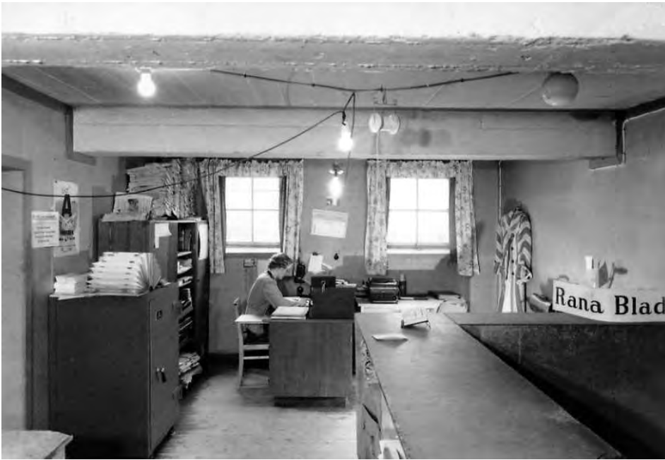
Frå redaksjonen i Rana Blad i slutten av 1940-åra.