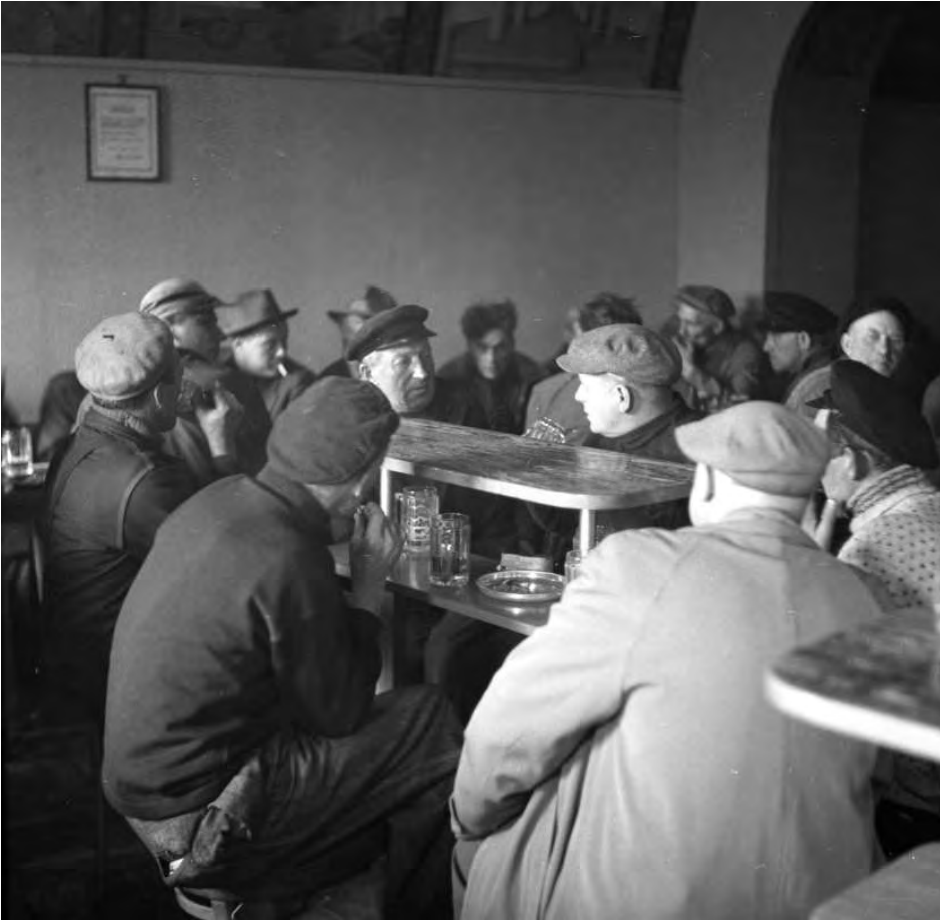
Ølhallen i Tromsø var ein stad der ei samansett gruppe frå fiskar- og fangstmiljøet møttes. Biletet er frå 1957.