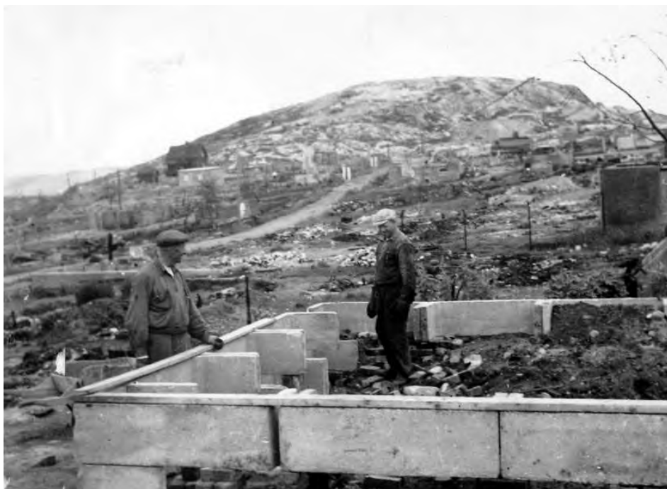
Dei nord-norske avisene tok etter krigen til orde for ein aktiv Nord-Norge-politikk. Biletet er frå gjenreisinga i Kirkenes.

landsdelen som grensar mot Trøndelag, vart det på 1930-talet endå til etablert ei avis med namnet Midt-Norge. Det er også påfallande at svært få av arbeidavisene i landsdelen fekk namn som tilsa at dei var nettopp det. Unnataket er Helgeland Arbeiderblad (Mosjøen, frå 1930) og NKP-avisene Nordland Arbeiderblad (Bodø 1931-36, Narvik 1931-58) og Troms Arbeiderblad (Tromsø 1933-34). Tre andre kommunistaviser i landsdelen, Friheten i Svolvær på 1920-talet, Folkerøsten/Røsten i Kirkenes (1928-1940) og Troms fylkes kommunistblad (Tromsø 1923/24) profilerte seg med namn som refererte til ideologi og politisk ståstad. At arbeidspartiavisene i mindre grad enn sørpå definerte