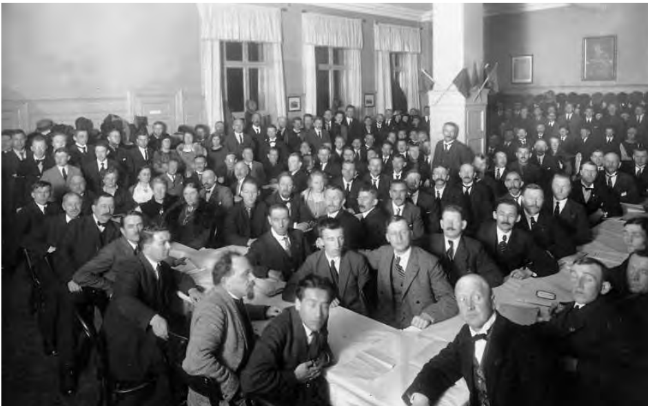
Fra stiftelsesmøtet i Norges Kommunistiske Parti (NKP) etter splittelsen i Arbeiderpartiet 1923. Partisplittelsen førte også til en kamp om partiavisene.

I tråd med framveksten av den organiserte arbeiderbevegelsen ble det fra