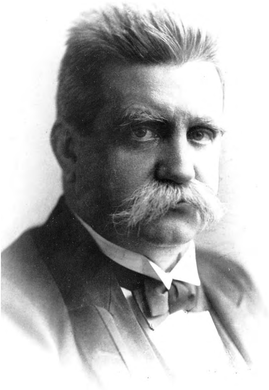
Hjalmar Branting (1860-1925) redaktør i Social-Demokraten fra 1887. Som den første og eneste representant fra det svenske sosialdemokratiet ble han valgt inn i Riksdagen i 1897. Branting fikk i 1921 Nobels fredspris for sin fredsbevarende innsats under unionsstriden.