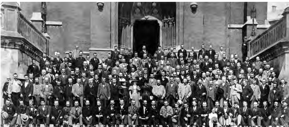
Deltakerne på den 5. skandinaviske arbeiderkongress i Stockholm i 1897.

Å andra sidan framhöll Branting nödvändigheten av att lösa unionskonflikten för att möjliggöra det därigenom blockerade reformarbetet i Sverige socialt och politiskt. «Arbetarna vilja ha fred från storpolitik och plats för sociala reformer», skrev han i Social-Demokraten den 24 januari 1903 i en artikel om konsulatfrågan. Den femte skandinaviska arbetarekongressen 1897 konstaterade i sin resolution om freds- och unionsfrågor att unionsstriden «försvagat intresse för de sociala frågorna» i Sverige och Norge och betecknade den som en «täckmantel [...] mot de bägge folkens demokratiska utveckling». 23 Unionsstriden hindrade den socialdemokratiska makterövringskonception som Branting omfattade: att aktivt kämpa