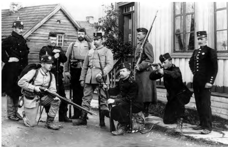
Både i Sverige och Norge ökade den militära opprustningen fram mot 1905. Her poserer norske soldater i nye uniformer og med nye geværer.

ske». DNA:s landsmöte i mitten av juni uttalade sig dock utan nationalistiska övertoner. Kontrasten mot den av Branting ledda svenska socialdemokratiska ståndpunkten har diskuterats främst i den norska litteraturen. 20 Medan de norska socialdemokraterna anslöt sig till nationalismen, med delvis till och med chauvinistiska inslag, tog de svenska socialdemokraterna ställning mot nationalismen och agerade «unasjonalt». Det fanns olika förutsättningar. I Norge kämpade socialdemokraterna och de demokratiska krafterna för den norska nationens rätt och självbestämmande och mot en främmande överhöghet, kampen var anti-svensk. I Sverige kämpade socialdemokratin både inrikes- och utrikespolitiskt mot den dominerande nationalistiska och chauvinistiska högern och det stöd de fick