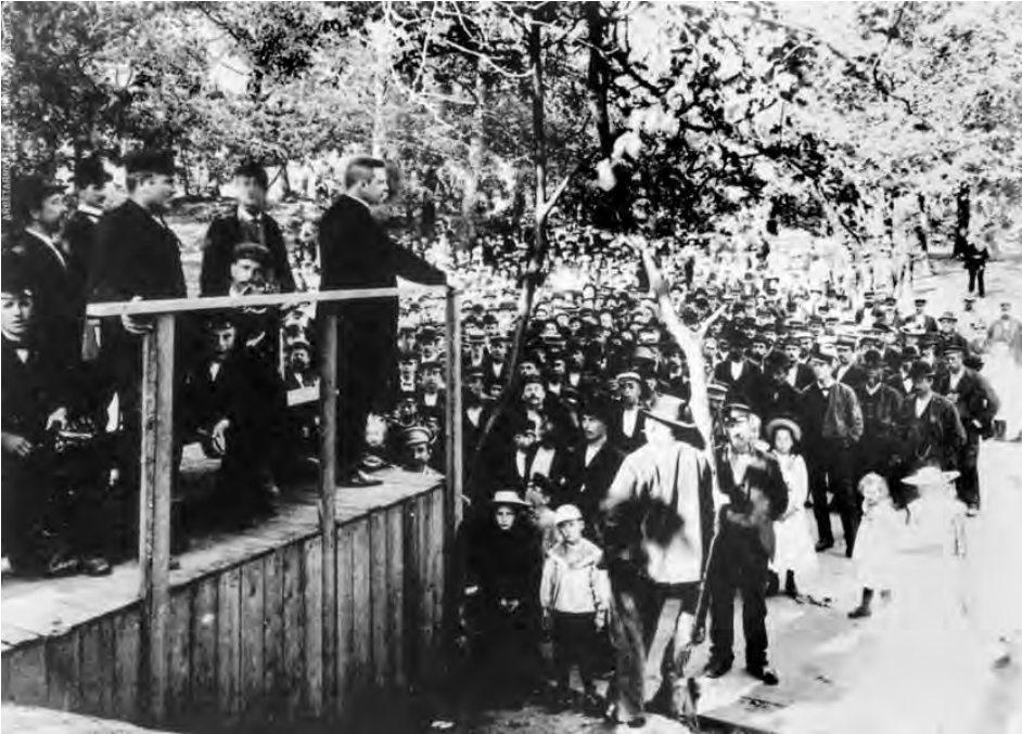
Hjalmar Branting var ettertraktet taler både i Sverige og Norge. Her er Branting i Sickla Folk-park utenfor Stockholm i 1905.

som omtalat att få honom till Kristiania dock utan att lyckas. Men August Palm höll i november 1895 ett föredrag på ett av DNA arrangerat offentligt möte där han bland annat uttalade sig för en unionsupplösning i motsats till sin tidigare – och senare – uppfattning. 30 1896 och 1897 försökte man från norsk sida få Branting att tala på 17-majmöten, men utan framgång eftersom Branting var engagerad på annat håll. Man framhöll 1896 att det vore «af den største betydning» om en svensk talade om «fred og broderskab netop paa denne dag». 31 Därremot uppträdde Branting på 17-majfesten 1898. Unionen nämndes inte direkt i hans tal, men påpekandet att mötesdeltagarna lyssnade till en svensk –