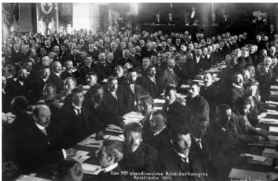
Den 7. skandinaviske Arbeiderkongress, den første etter unionsoppløsningen, ble holdt i Kristiania i 1907.