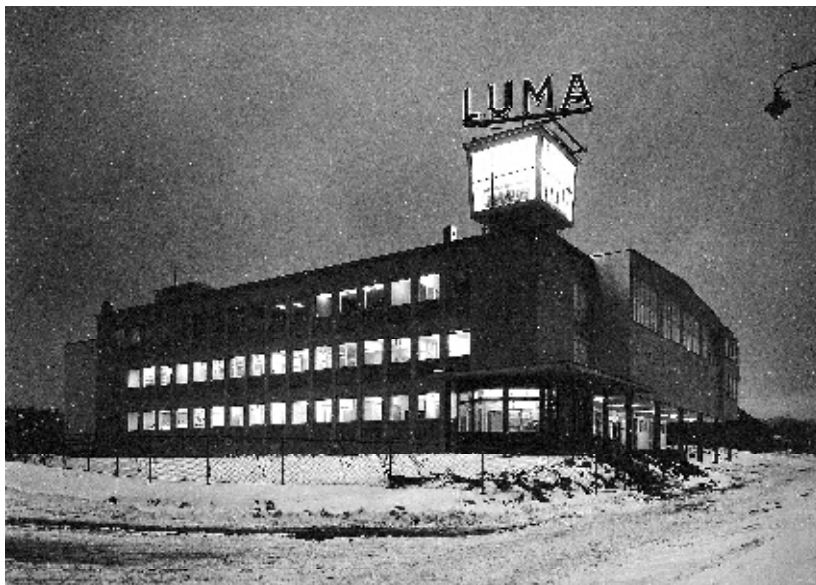
Lumas nye fabrikk sto ferdig i Ensjøveien 8/10 i 1956. Lystårnet for prøvebrenning av pærer var godt synlig i byområdet.

NKL så det ikke lenger som mulig å fortsette driften ved Luma på samme måte som før. Luma var blitt en betydelig økonomisk belastning. Flere ville legge ned bedriften. Alternativene var enten å avvikle produksjonen og si opp de ansatte, eller å søke bistand hos den svenske kooperasjonen. Det må antas at både Philips og Osram var interessert i å kjøpe Luma, men for NKL ville et slikt salg til de private konkurrentene ha medført et altfor stort prestisjetap. 1. januar 1964 overtok Lumalampan 50 prosent av aksjene i norsk Luma. Med om lag 1100 ansatte var Lumalampan Nordens største lyspæreprodusent. Formelt ble Luma et norsk-svensk aksjeselskap med norsk styreflertall. I realiteten var partene innforstått med at norsk Luma skulle være et datterforetak av Lumalampan. Det skulle ligge hos svenskene å disponere eventuelle overskudd, bære eventuelle tap og trekke opp retningslinjer for produksjon og salg. NKL skulle ikke motsette seg nedleggelse dersom KF ønsket det. I en slik situasjon skulle NKL ha rett til å kjøpe tilbake aksjene og utløse svenskene. 23