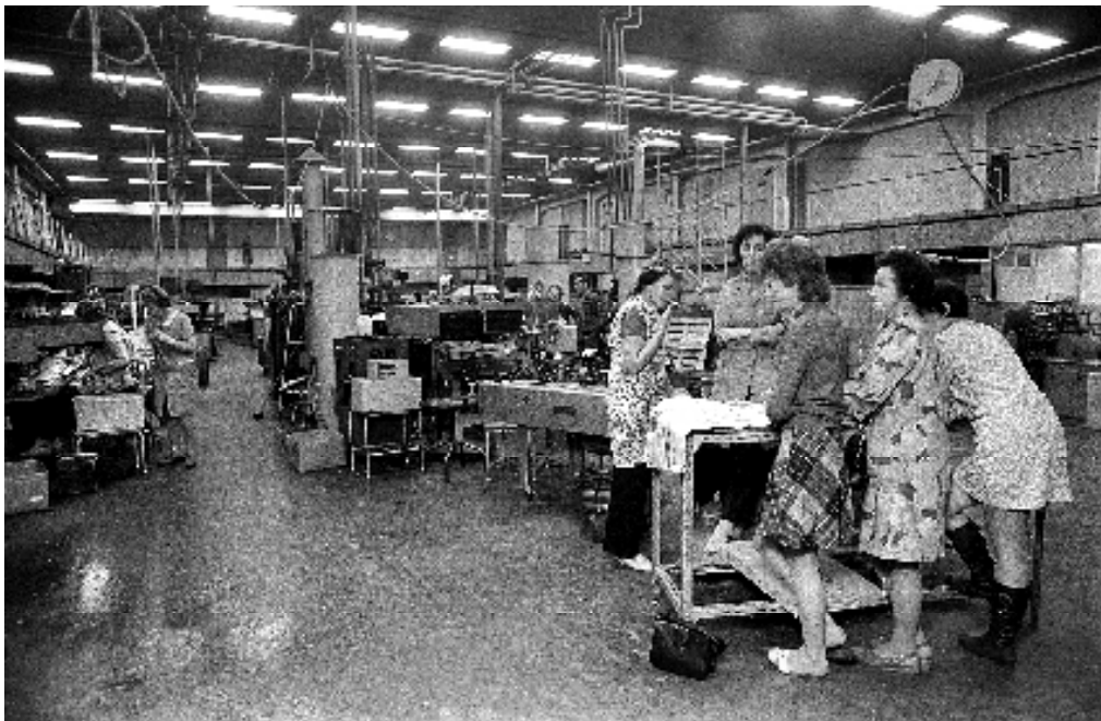
Tirsdag 20. desember 1972 stanset maskinene i produksjonshallen ved Luma Fabrikker i Oslo.

Parallelt med at ledelsens tilbud ble vurdert av de ansatte og deres tillitsvalgte i august, hadde de ansattes arbeidsutvalg fortsatt langs et eget spor. Arbeidsutvalget tok kontakt med Oslo kommune for å få bistand til