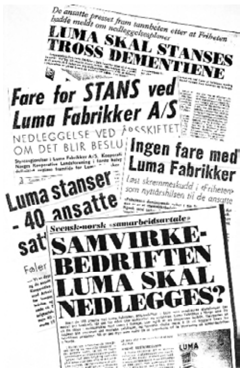
Avisoppslag i Friheten og Arbeiderbladet om nedleggelse av Luma fabrikk i 1972.