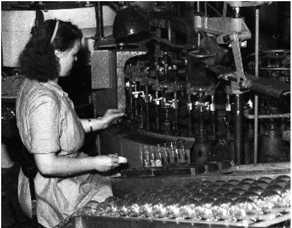
I 1947 var 80 arbeidere og funksjonærer ansatt ved Luma fabrikk. Ved en nedslitt smeltemaskin ble foten og glasskolben på lyspæren koblet sammen.

I reklamen for Lumas lyspærer hadde det tidlig blitt lagt vekt på at de var et ekte norsk produkt. Slagordene var blant annet «LUMA. Den strålende norske lampe», «LUMA. Den er norsk og den er god» og «LUMA.