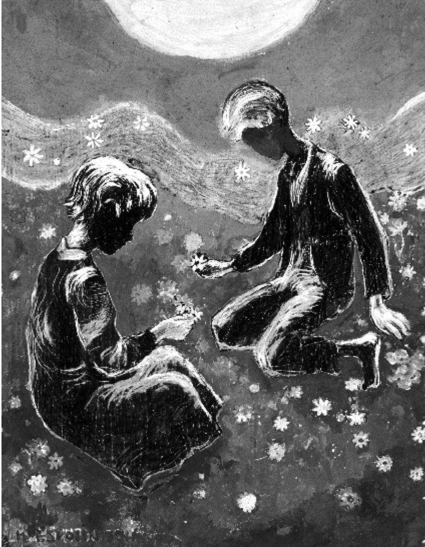
«Sommer», forside til Arbeidermagasinet nr. 32, 1938.