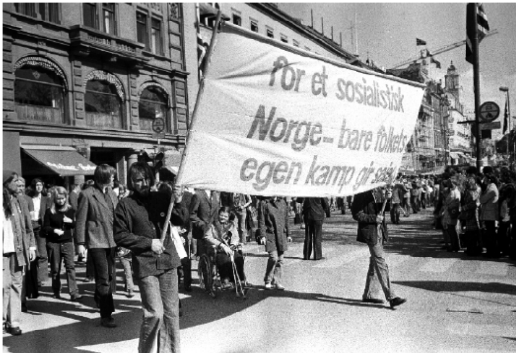
Faglig 1. maifronts tog 1972.

innpodet til å forstå sprengkraften i den nye maoistiske verdensanskuelsen. 18 Teorien om de tre verdener handlet i bunn og grunn om at Sovjet og USA - altså den første verden - var de farligste kreftene i verden. På bakgrunn av USAs nederlag i Vietnam og den tiltakende russiske styrkeoppbyggingen på 70-tallet, ble Sovjet utpekt som den største aggressoren. Rød Ungdom-delegasjonen tok med seg kinesernes analyse tilbake til Norge, og ledelsen i AKP(m-l) tok teorien ad notam. Dette - sammen med impulsene fra Albania - medførte en omorganisering av partiet. AKP(m-l) mente at Sovjet var i ferd med å ruste seg opp til storkrig og at Norge, med sin strategiske posisjon, ville bli angrepet og hærtatt i løpet av kort tid. Partiet trakk seg inn i seg selv og bort fra taktiske allianser med resten av venstresiden. I partiets tidsskrift Røde Fane het det: «Sovjetsamveldet er snart klar til å ta opp kampen med USA om å være den sterkeste. Da vil vi stå på randen av ny verdenskrig. (...) Sovjet er den mest sannsynlige krigsutløseren.» 19 Og 1. mai 1976 holdt Tron Øgrim en tale som skisserte den dystre framtiden som ventet Norge og ikke minst det lille maoistpartiet AKP(m-l) i fall en sovjetisk invasjon av Norge: «En sånn krig og okkupasjon blir jævla hard. Mye verre enn nazistenes. Under nazistene ble ingen norsk storby teppebomba. Det var ikke hungersnød. De skaut ikke alle som var mistenkt for kommunist sympatier. Hvis nord-