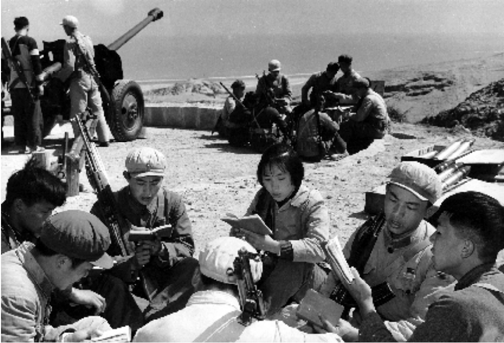
Kinesisk ungdom leser Maos lille røde. I Norge appellerte Mao både til teksttro og dogmatiske kommunister og til 1968-kommunister av det mer løselige slaget.

utrenskningene antok i 1937-38 et omfang som var større enn det burde.» 7 Et nokså ulekkert poeng, kan det kanskje hevdes i dag.