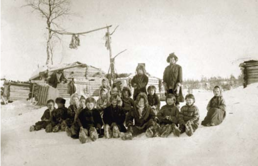
Skoltesamene i Øvre Skolteby fotografert av Ellisif Wessel i 1896. FOTO I FINNMARKSBIBLIOTEKETS ARKIV

Ellisif Wessel var også en dyktig amatør fotograf, selv om denne siden av henne i årenes løp har blitt tildelt mindre oppmerksomhet enn hennes politiske og litterære virksomhet. Hennes fotografier er blitt brukt som illustrasjoner i flere utgivelser i hennes egen tid og i enda større grad i ettertiden. I den senere tid har det også vært laget flere utstillinger av hennes bilder av museene i Nord-Norge og av andre, en del av hennes fotografier var med på utstillingen The Frozen Image - Scandinavian Photography i New York og Minneapolis allerede i 1983. 4