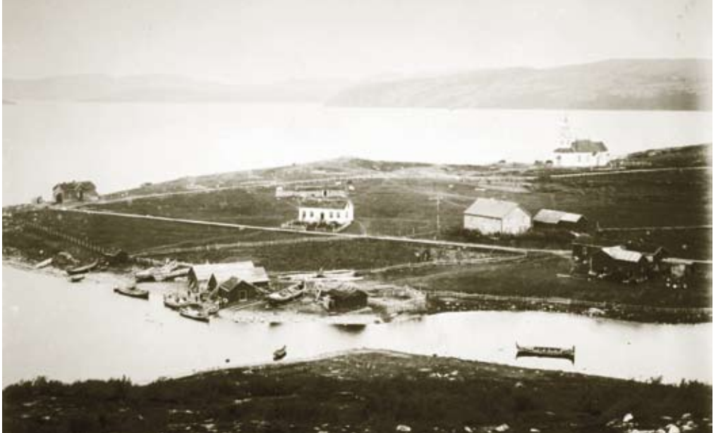
Utsikten over Kirkenes fra doktorboligen der ekteparet Wessel bodde.

Dette bildet tok Ellisif Wessel i 1896. FOTO I FINNMARKSBIBLIOTEKETS ARKIV