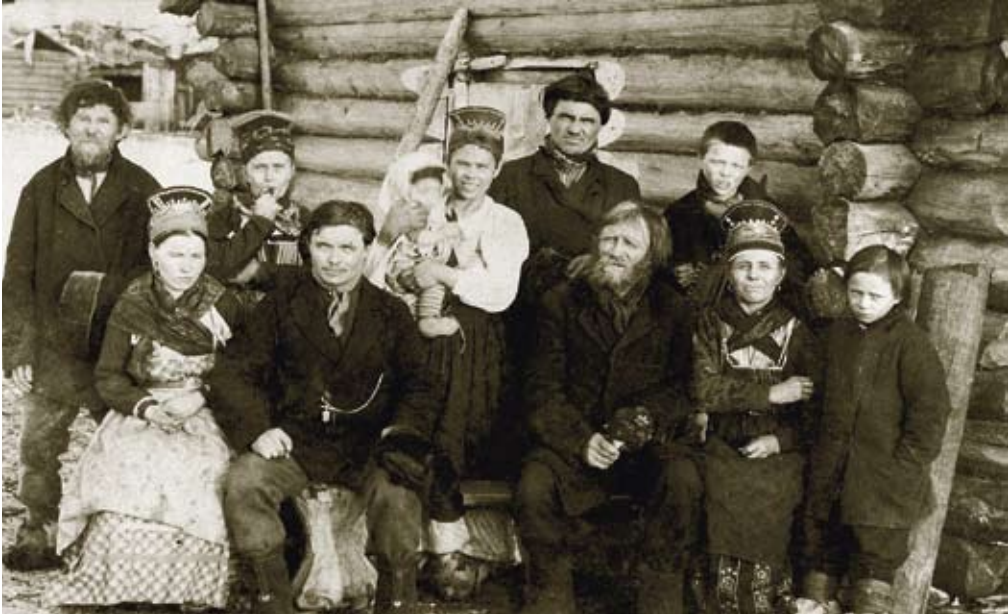
En familie fra landsbyen Notjavre i russisk Lappland. Dette er et av motivene som Ellisif Wessel fikk laget som postkort og sendt til venner og bekjente.

enn for eksempel det mer avanserte belgkameraet fra samme tid. Bokskameraet kunne ikke skarpstilles fra objektivet. Kvaliteten på objektivet kunne også variere mye. I en god del av Ellisifs første bilder kan man tydelig se kameraets begrensninger; en del av hennes landskapsbilder tatt før 1900 er uskarpe i kantene. Dette skyldes objektivet dårlige tegneegenskaper. Ellisif skaffet seg senere et bedre kamera, hennes bilder fra 1900-tallet er kvalitetmessig på et bedre nivå. Det er også mulig at hun eide flere kameraer, ekteparet Wessel var som nevnt velstående, de reiste også en del i Mellom-Europa på begynnelsen av 1900-tallet, der en lett kunne kjøpe en mer avansert kameratype.