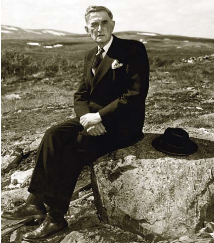
Johan Falkberget betegnet seg selv som en sønn av fjellet. Som journalist og forfatter satte han dype spor etter seg. Falkberget var født i Bergstaden Røros i 1879 og døde i 1967.

med det folket de tilhørte. De ble høvdinge, hver på sitt vis, men om dem alle kan man trygt si det som er sagt om den ene av dem: De beholdt sin høvdingrang i kampen for rett og framgang.