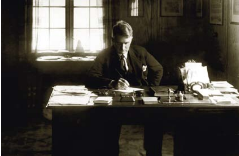
Johan Falkberget i stua på Ratvolden. Bildet er datert julen 1932 og ble sendt til venner som julekort.

store femtikronershonorarer - vi hørte tale om - øvde alltid en sterk tiltrekning. Den som fikk et par vers eller en kronikk inn dørene der kunne nemlig gjøre det han selv lystet - han kunne til og med gå på Grand!