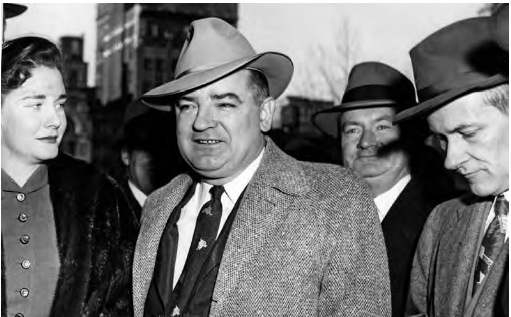
Den amerikanske senatoren Joseph McCarthy gikk til angrep på det han betraktet som kommunistisk infiltrasjon i statsapparatet i USA. Blant dem som etablerte Orientering var det flere som følte seg utsatt for meningssensur og norsk «mccarthyisme».