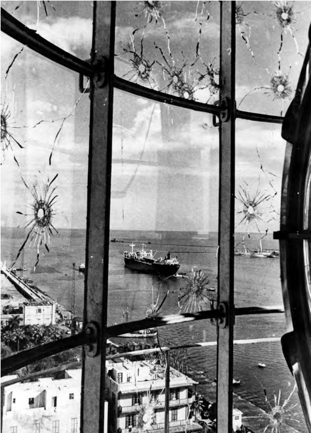
Suez-krise i 1956, der Storbritannia og Frankrike tok kontroll over Suez-kanalen, ble gitt stor oppmerksomhet i Orientering. Bildet er tatt fra fyrtårnet i Port Said, ved kanalens nordlige munning.