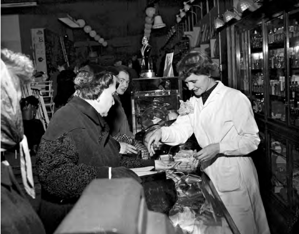
Giftede kvinner skulle kunne gå ut i et arbeidsliv som var tilpasset deres hverdag som husmødre.

det er rimelig å vurdere denne oppmerksomheten omkring husmødrene som en grunnleggende tradisjonell kjønnspolitikk, og den norske varianten som den mest tradisjonelle og kjønnskonservative av dem alle.