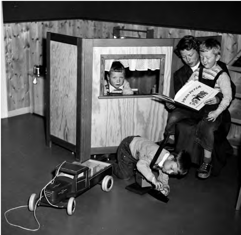
Manglende satsning på barnehager gjorde det vanskelig for husmødre å gå ut i aktivt yrkesarbeid.

Flere initiativer ble også tatt for å utrede mulighetene for å tilrettelegge bedre for yrkesarbeid, og man så tidlig ganske klart hvilke tiltak som trengtes for å gjøre det enklere å kombinere arbeid og familie. Barnehager, husmorvikarer, utvidede åpningstider og omlegging av skattepolitikken, er tiltak som stadig var oppe i diskusjonen. Når disse bare i begrenset grad ble omsatt i handling, strandet det iblant på direkte interessekonflikter med andre grupper. Langt oftere strandet imidlertid initiativene på manglende bevilgninger til å følge dem opp. Sammenliknet med svenskene var den norske staten atskillig mindre sjenerøs med langvarige sosiale forpliktelser som innebar store statsbevilgninger. Det gjaldt i høy grad statlig støtte til daghjem og barnehager, som etter alt å dømme var det aller viktigste tiltaket for husmødre som kunne tenke seg yrkesarbeid. Selv om både arbeidskontorer og