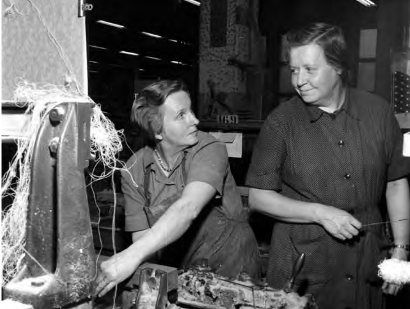
Den såkalte samskatten bidro til at yrkeshusmødrenes lønnsarbeid ikke lønte seg.

Men verken barnehager eller husmorvikartjenester var tiltak som ble utformet primært med yrkeshusmødrene i tankene. Det var sosiale tilbud som skulle komme alle husmødre til gode. Husmorvikarene skulle også hjelpe en husmor hjemme hvis det var sykdom i familien, eller særlig hvis det kom et nytt barn. Og barnehagene skulle gi husmødrene fri noen timer hver dag. Det sentrale for fulltidshusmødrene var nettopp å sikre retten til fritid og muligheter til å delta i samfunnet utenfor familien. Den store sosiale reformen for dem skulle være husmorferien, som kompensasjon og ekvivalent til de ferieukene som var lovfestet rett for alle lønnsarbeidere. Husmorpolitikken var dermed tosidig; den inneholdt både tiltak som skulle komme heltidshusmoren til gode, og tiltak som skulle gjøre det mulig å ta lønnsarbeid utenfor hjemmet.