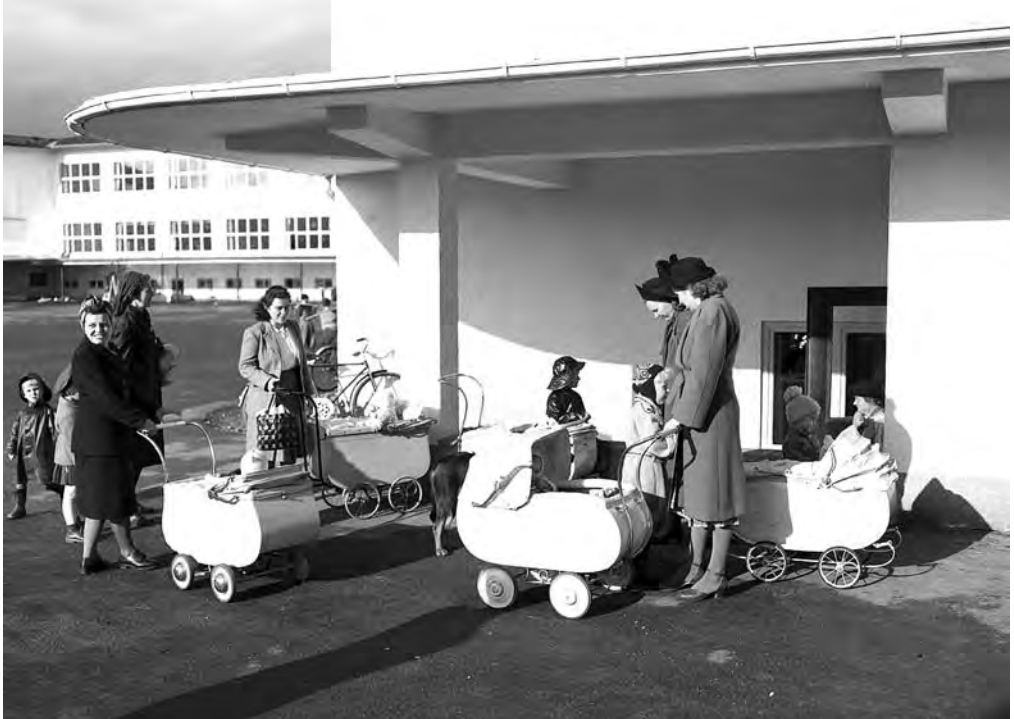
Babyboomen i Norge var eksepsjonelt sterk de første frigjøringsårene. Fra helsestasjonen på Majorstua 1949.

hadde nok krigen bidratt til å styrke samforståelse over klassegrensene. På den andre siden skapte overgangen fra krig til fred et kolossalt forventningspress fra interessegrupper både i og utenfor arbeiderbevegelsen. Ledende sosialdemokrater måtte stadig minne om at arbeiderbevegelsen og kvinnebevegelsen ikke lenger var i opposisjon, og at for stor kravmentalitet bidro til å styrke den politiske opposisjonen. Partimedlemmene måtte få med seg den endrede situasjonen som gjorde «den gamle partiplikten til det den er i dag, lik samfunnsplikten». 16 Det kan også virke som om vektleggingen av den individuelle friheten og de demokratiske rettighetene fikk en langt mer framtrædende plass i den politiske retorikken i Norge, i alle fall i de første frigjøringsårene. For eksempel kom spørsmålet om en grunnlovsfesting av «retten til arbeid» aldri på det svenske sosialdemokratiets programmer, mens dette ble fremmet med styrke av arbeiderbevegelsene både i Danmark og Norge. Hvordan krigen satte sine spor på etterkrigstidens politiske diskurser, er et tema som i høy grad kunne fortjene mer systematisk utforskning.