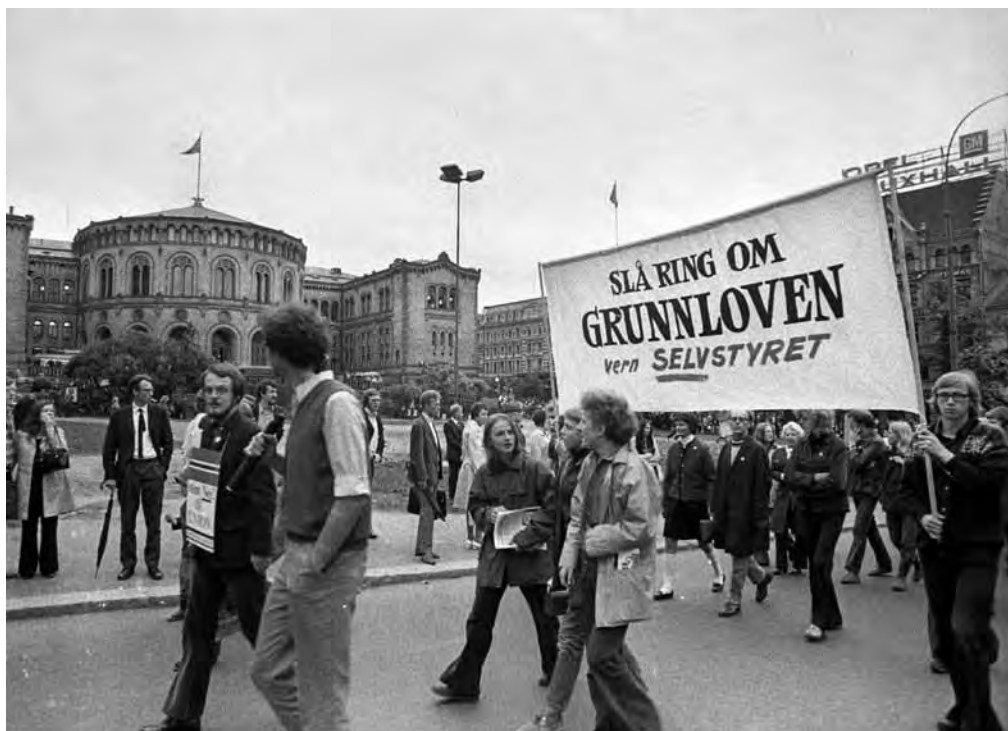
AUFs brede engasjement på neisiden under EF-kampen i 1972 førte til den største konflikten med partiledelsen på flere tiår. Bildet er fra Folkebevegelsens demonstrasjonstog i juni 1972.

Men en rest av AIK valgte å bryte med partiet og danne et eget parti. En del ledende AUFere sluttet seg til dette bruddet og brøt dermed også med AUF. Det totale tallet var ikke veldig høyt. Men det gjaldt atskillige