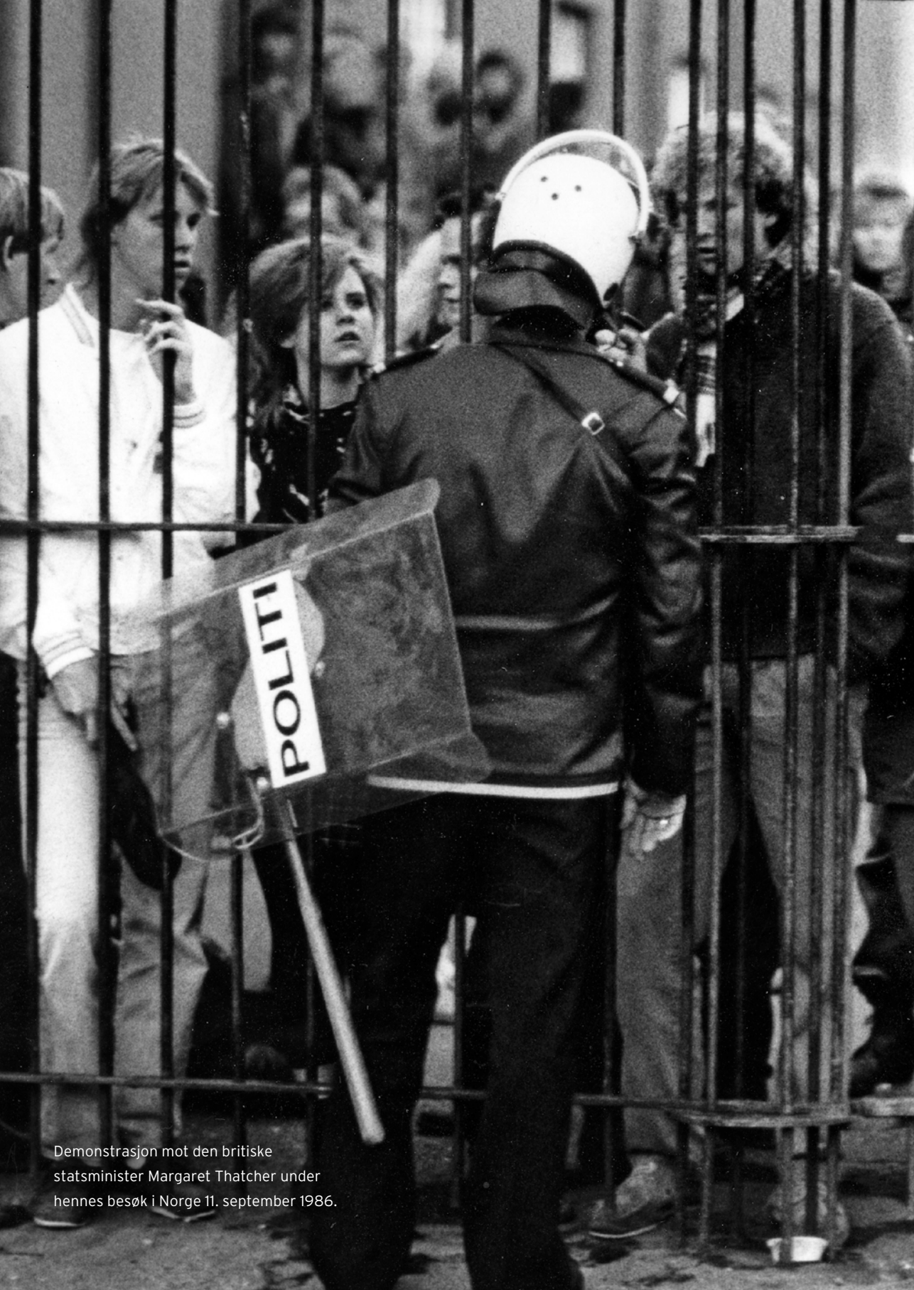
Demonstrasjon mot den britiske statsminister Margaret Thatcher under hennes besøk i Norge 11. september 1986.