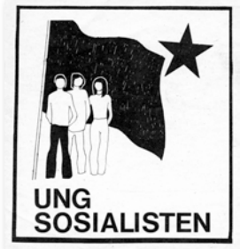
Ungsosialisten var medlemsbladet til Sosialistisk Ungdomsforbund.