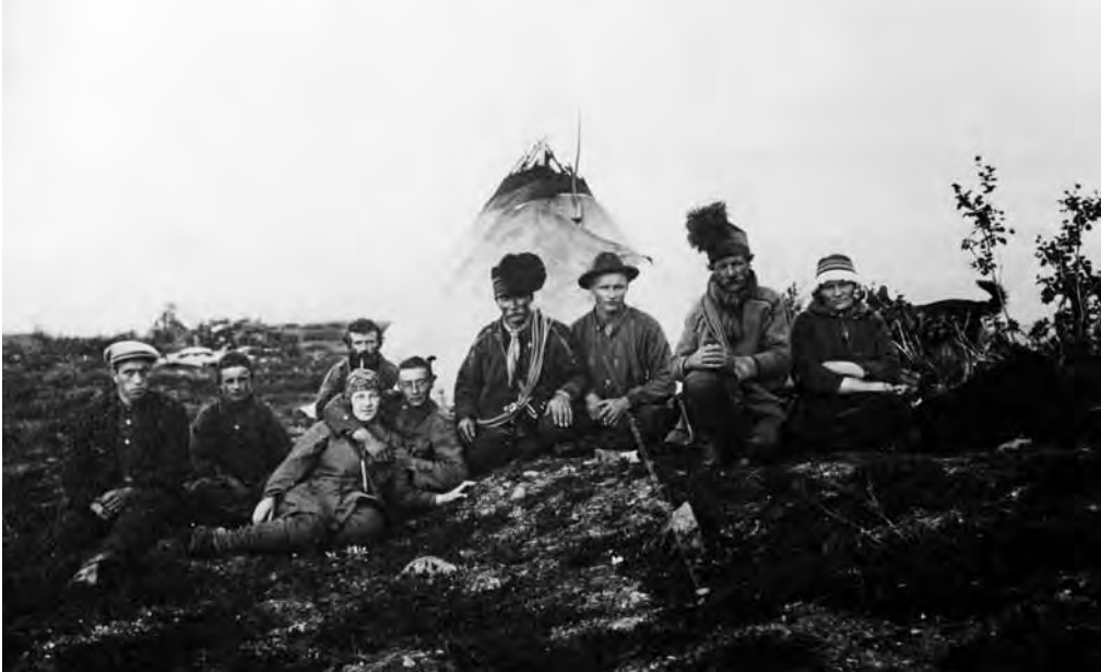
I Sulitjelma på 1920-tallet; her ser vi samer og norske arbeidere sammen foran lavvoen.

diskrimineringa av dei etniske og religiøse minoritetane i landet gjennom å sikre dei likeverd med andre borgarar og ei sjølvstendig utvikling. Året etter blei erklæringa innarbeidd i konstitusjonen, og i tillegg skulle alle etniske grupper ha rett på autonome område. Fram mot byrjinga av 1930-talet, da minoritetspolitikken brutalt og utan nåde blei lagt om, retta Sovjetunionen ein særleg innsats mot dei nordlege områda av landet, mellom anna med ein eigen komité som skulle arbeide for å fremme økonomisk og kulturell utvikling av folkegruppene i nord. Målet var at dei skulle vere nasjonale i form og sosialistiske i innhald. Ei av dei folkegruppene dette arbeidet retta seg mot var austsamane på Kola-halvøya. Ei prioritert oppgåve var alfabetisering og morsmålsopplæring og som eit ledd i dette blei utdanning av lærarar med minoritetsbakgrunn eit satsingsfelt. Det blei mellom anna etablert eit eige pedagogisk institutt ved Universitetet i Leningrad som hadde til oppgåve å arbeide med problematikk relatert til minoritetane i nord. 28