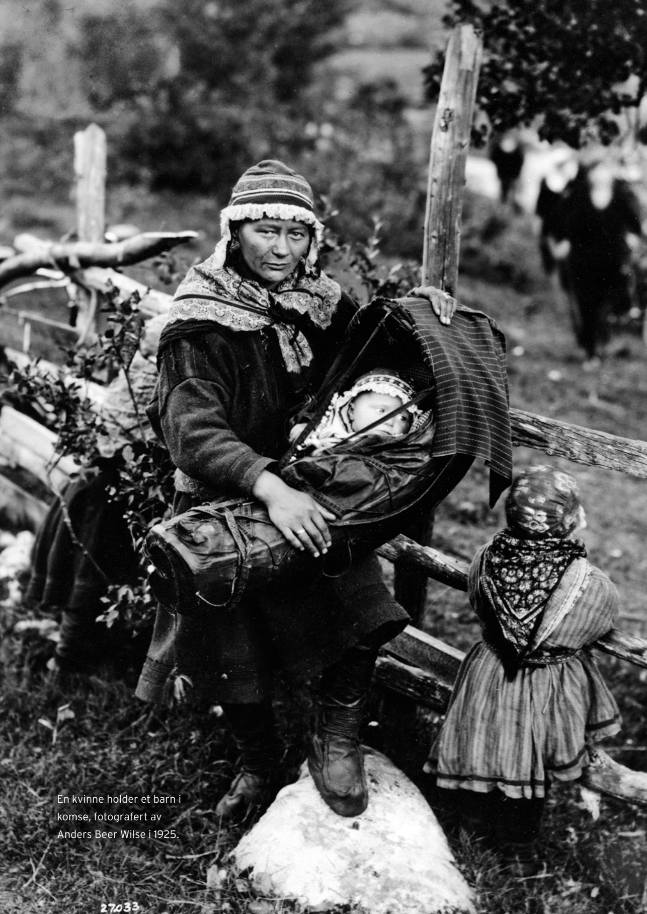
En kvinne holder et barn i komse, fotografert av Anders Beer Wilse i 1925.