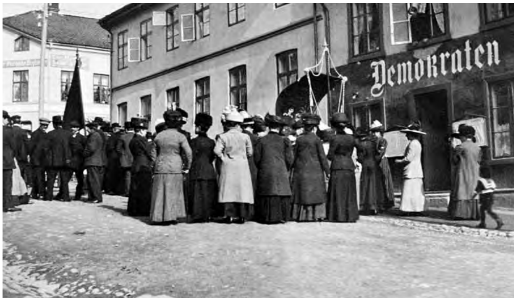
Lokalene til Demokraten lå i Sverres gate med redaksjonen i andre etasje. Her gjøres det klart til 1. mai-tog i 1910.

siktes det til etableringen av et Arbeidernes Pressekontor i 1912, 21 selv om det er tvilsomt om etableringen kan tolkes som et tidlig utslag av sentralisering. 22 Etter andre verdenskrig ble sentraliseringen omtalt i innforståtte termer, slik at det i et tilbakeblikk på perioden før første verdenskrig kunne hete: «Sentralstyret hadde imidlertid ikke samme innflytelse over de enkelte papiraviser som nå». 23 Den øvrige pressen fulgte for øvrig etter arbeiderpressen i grad av partiloyalitet, slik at partipressen som institusjon i Norge først sto i «senit» mellom 1945 og 1972. 24