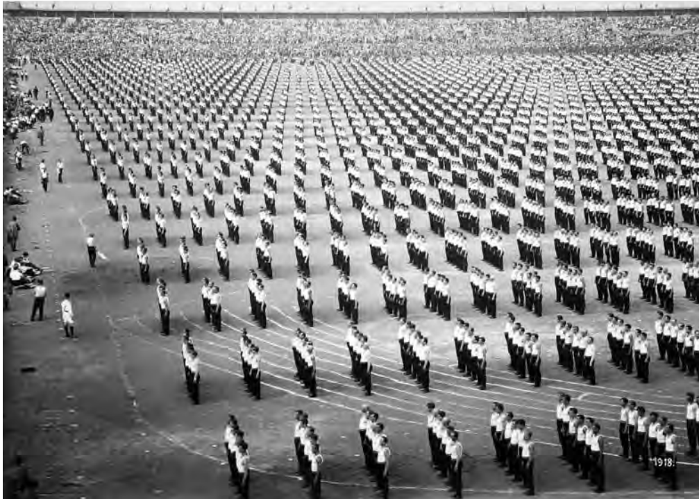
Millimeterpresisjon var viktig når arbeideridretten skulle propagandere for sin sak. Fotografi fra et arbeiderturnstevne i Praha 1932.

oppslutning i Trondheim og i Bergen, en liten minoritet på landsbasis. I 1935 gikk Kampfbundet inn i AIF.