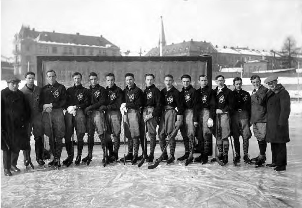
Det russiske bandylaget, fotografert på Dælenenga idrettsplass under Spartakiaden i Oslo, februar 1928.

med AIFs ledelse i spissen ønsket å nedtone det propagandamessige ved Vinterspartakiaden og heller fremheve idretten. Dette skapte misnøye hos RSIs delegasjon. Sportslig gikk arrangementet stort sett knirkefritt. Blant annet ble skøytetidene på Bislett bedre enn under et borgerlig stevne som ble holdt samtidig på Frogner Stadion. Sportshallen på Kampen var smekkefull under boksekampene. 66 Offisielt omtalte RSIs delegasjon Vinterspartakiaden som en suksess. 67 Uoffisielt var det derimot mye delegasjonen var misfornøyd med. Dette gjaldt alt fra forbedelsene til stevnet, det propagandamessige under stevnet, til premiene som ble sett på som borgerlige. I tillegg ble det også gitt uttrykk for misnøye med AIF-ledelsens opptreden under stevnet. 68