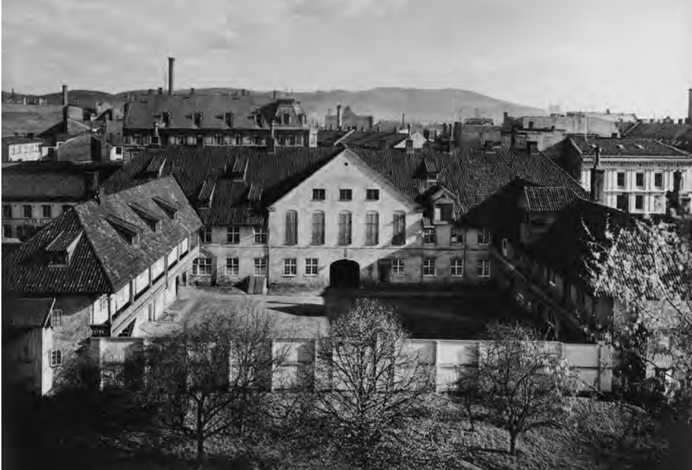
Kristiania Tukthus sto ferdig i Storgata 33 i 1741. Fotografiet er fra rundt 1910.

Dersom de formuende familiene heller vasket sitt tøy hos Tukthuset, ble samhandlingen brutt og samfunnet led et betydelig tap. Dette argumentet avslører at Ordning var påvirket av en paternalistisk tankegang, det vil si at de mer bemidlede i samfunnet hadde et moralsk og økonomisk ansvar for de mindre bemidlede.