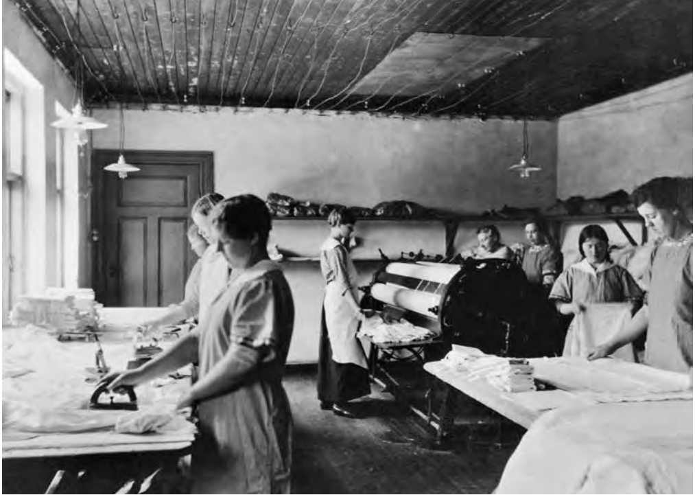
Tukthuset var ikke den eneste anstalten som drev med vaskerivirksomhet. Slik så det ut da kvinnene på Ebenezer redningshjem for prostituerte vasket tøy rundt 1910.

men at Tukthuset drev vaskeri i en skala som representerte en konkurranse som påvirket priser og tilgangen på arbeid bør være utenfor tvil.