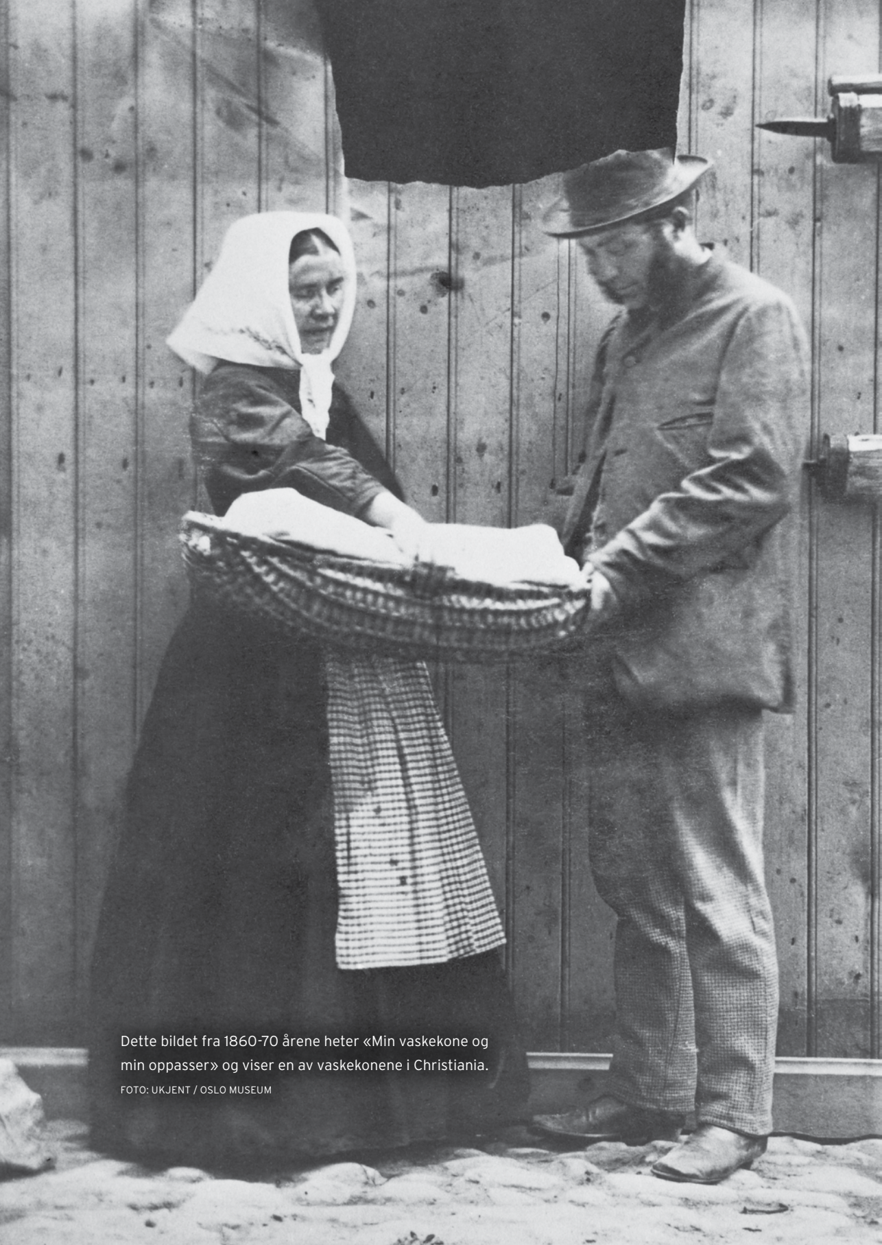
Dette bildet fra 1860-70 årene heter «Min vaskekone og min oppasser» og viser en av vaskekonene i Christiania.