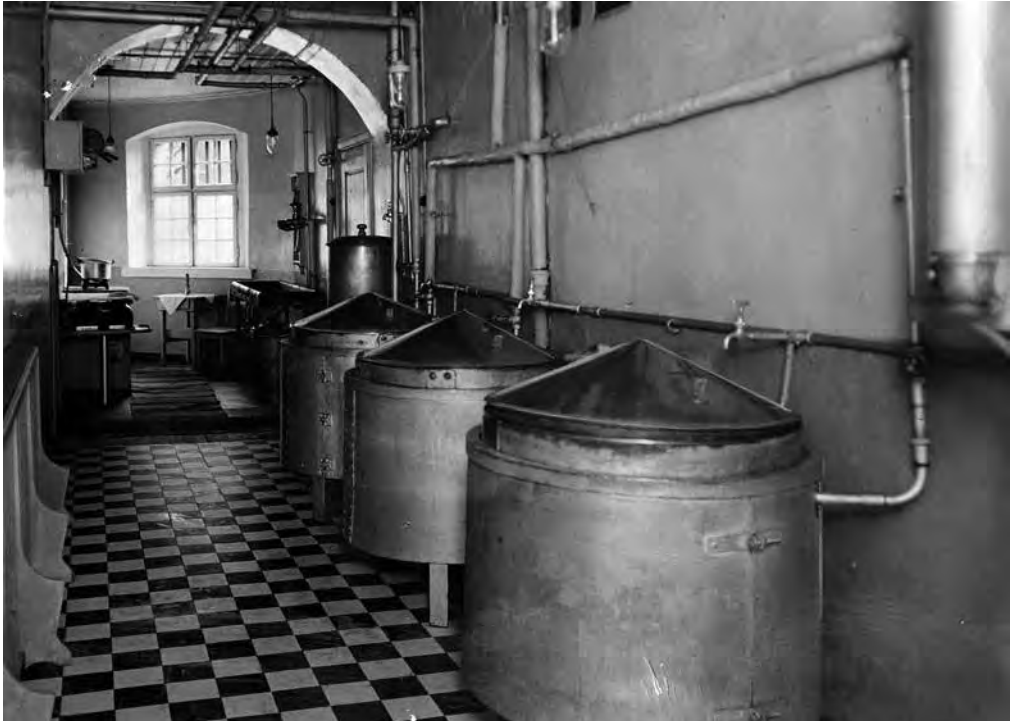
Tukthusets vaskerivirksomhet foregikk i stor skala, og vaskeriet var i bruk helt til det siste. Dette bildet er tatt på slutten av 1930-årene, før rivingen av bygget i 1938.

neste til anstalten. Tar vi vekk faktoren stat versus kommune, blir arbeidsvirksomheten altså utelukkende positiv for myndighetene. I tillegg til dette fikk jo – som fattigkommisjonens flertall påpekte – byens formuende familier bedre og billigere vask, en faktor som veide tyngre enn arbeidernes tapte arbeidsinntekt. En kan også spekulere i om denne tapte arbeidsinntekten førte til at arbeiderne gikk med på å arbeide for mindre penger – det er i hvert fall tydelig at vaskekonene senket prisene sine for å konkurrere med Tukthuset.