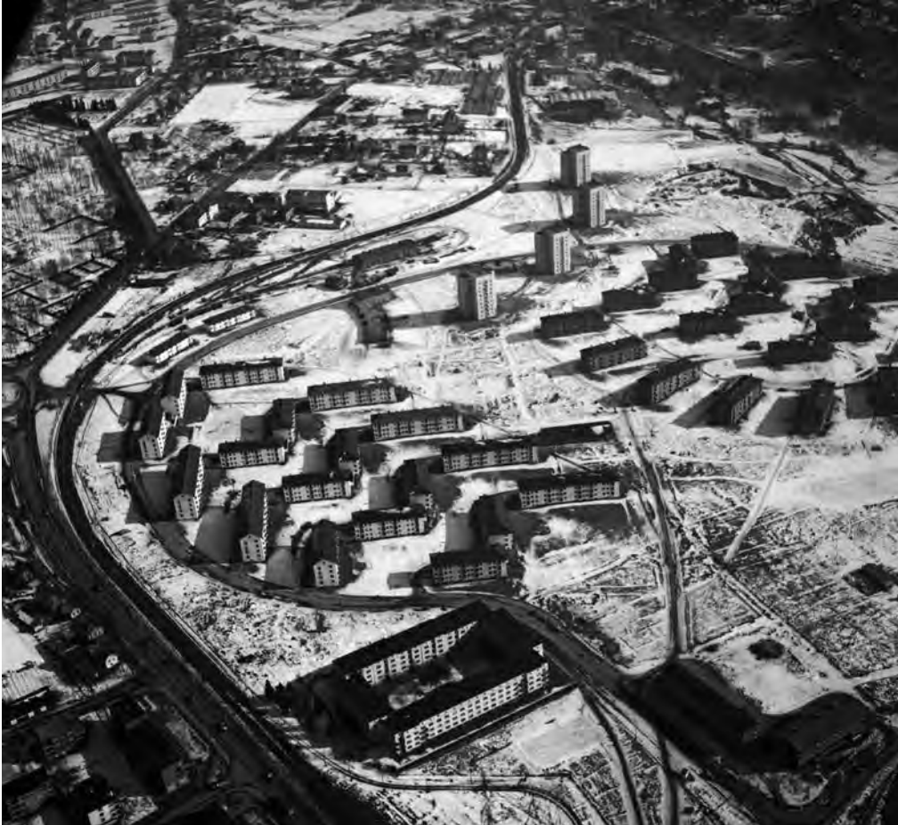
Flyfoto over Etterstad fra 1955, med det aller første OBOS-borettslaget fra 1931 nederst i bildet, og et typisk boligfelt fra 1950-tallet rundt.

Boligsamvirket tok avstand fra den private gårdeierbusinessen Brateli foraktet. Idealet var produksjon, drift og omsetning av boliger etter selvkostprinsippet. Prisen på boliger og tomter skulle enkelt sagt reflektere det de kostet å produsere. Boligkooperasjonens formål var ikke privat profitt, men kontinuerlig bygging og drift av boliger til medlemmenes fordel. I teorien fantes det heller ikke leieboere og gårdeiere i boligkooperasjonen, borettslaga var «sjølleiere», de styrte seg selv og eide sine andelsleiligheter i fellesskap. Ifølge den sosialdemokratiske boligortodoksien stoppet ikke fellesskapets grenser ved den enkeltes dørstokk, tvert imot var boligkooperasjonen tuftet på tanken om solidaritet mellom boende og boligsøkende medlemmer. 31