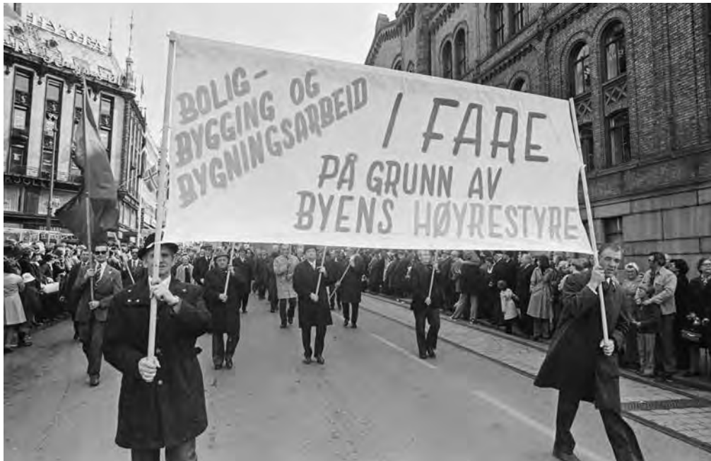
Fra 1. mai-toget i Oslo i 1977. Ikke alle var enige i Høyres boligpolitikk.

begynnelsen av 1970-tallet, var sentrale aktører som Reiulf Steen og Per Kleppe skeptiske til å flagge alt for skarpe holdninger i boligbeskatningsdebatten etter kontroversene rundt Riksskattestyrets rundskriv. 64 Parti-sekretær Ronald Bye var også kritisk til Arbeiderpartiets linje i debatten om boligskatt. Hans bok fra 1975, Synspunkter og vurderinger , kan leses som et forsvar for den vanlige arbeiders rett til bil, bolig og hytte. 65