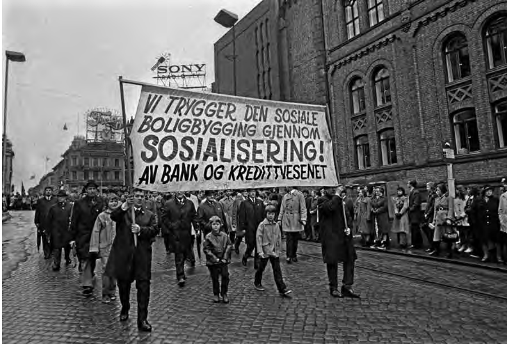
Den sosiale boligbyggingen var et av temaene i 1.mai-toget i Oslo i 1973.

ding. Disse høringsinstansene advarte blant annet mot store administrative kostnader og utilsiktede konsekvenser. 45